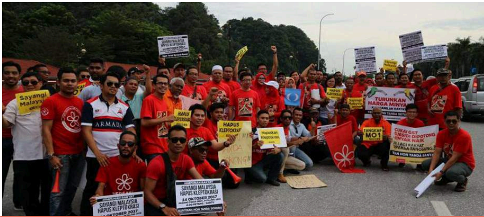
IMPAK MAKSIMA... Peserta aksi kilas Sayangi Malaysia anjuran Pemuda Pakatan Harapan Perak di Medan Gopeng Ipoh, 11 Oktober lalu dilihat paling ramai dalam satu-satu aksi berbanding negeri lain dengan pengguna jalan raya memberi reaksi positif.