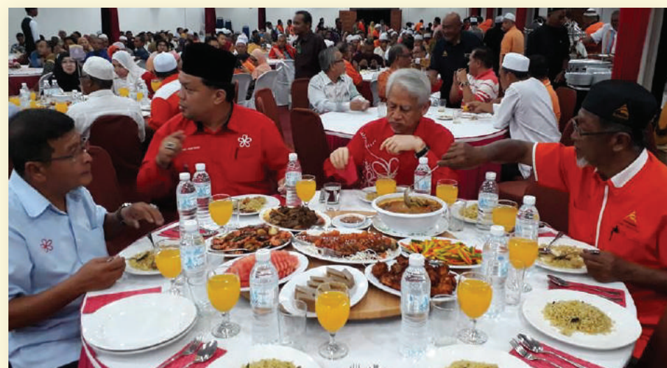
Para pemimpin PH negeri sedang menjamu selera.