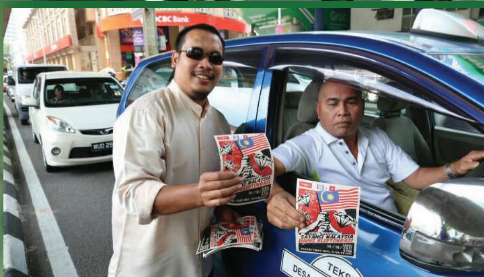
Seorang pemandu teksi menyatakan sokongan terhadap himpunan 14 Oktober.