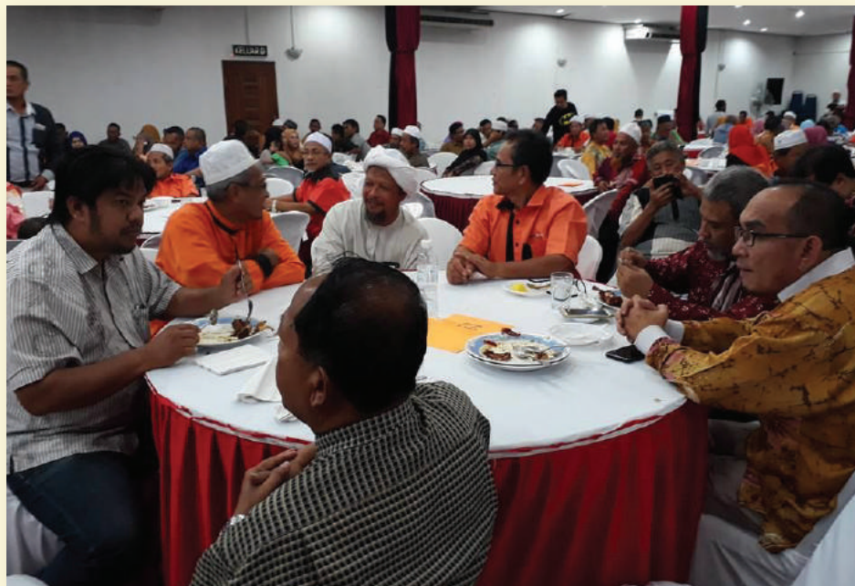
Antara aktivis AMANAH negeri yang hadir memeriahkan majlis.

P ASIR PUTEH: Kehadiran lebih 1000 tetamu pada Majlis Makan Malam Kelantan, 10 Okt lalu mengujakan Presiden AMANAH Mohamad Sabu.