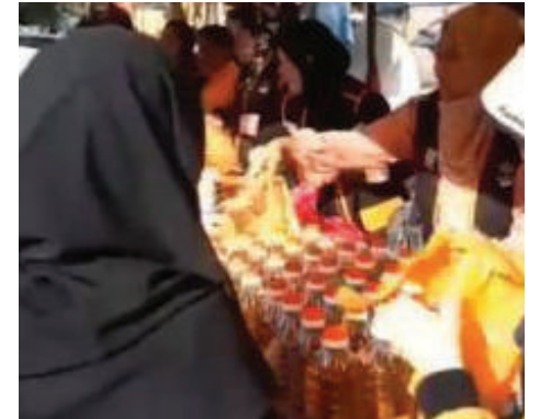
Minyak masak 1 kg dijual dengan harga RM2 sebotol.