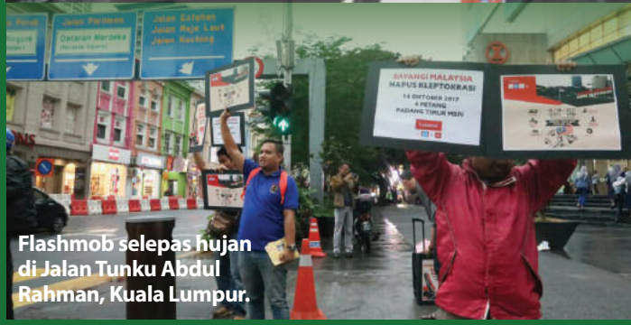
Flashmob selepas hujan di Jalan Tunku Abdul Rahman, Kuala Lumpur.