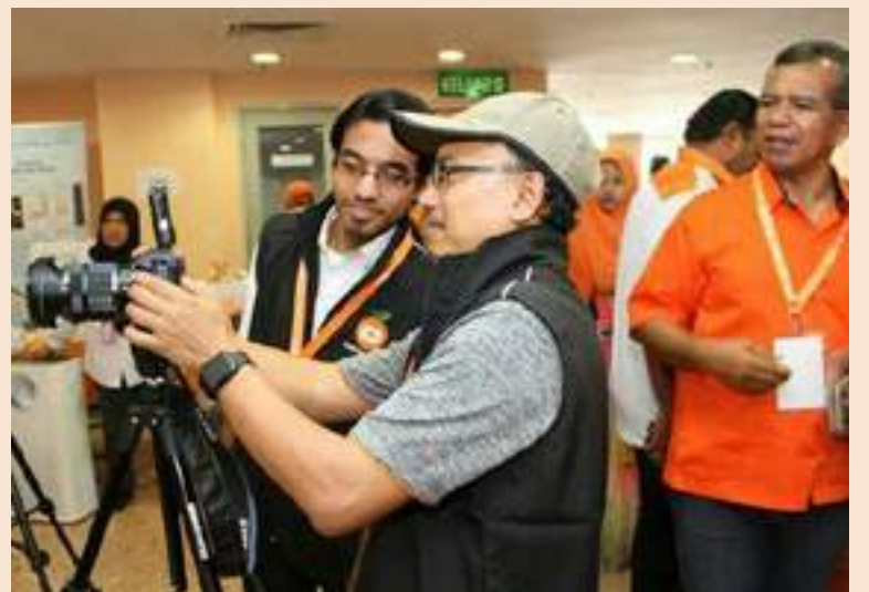
Memerhati petugas Media Oren menjalankan tugas.

Ayuh ikhwah, Derapkan terus langkah kaki ini... Hanyasanya kematian itu sahajalah kerehatan sebenarnya!