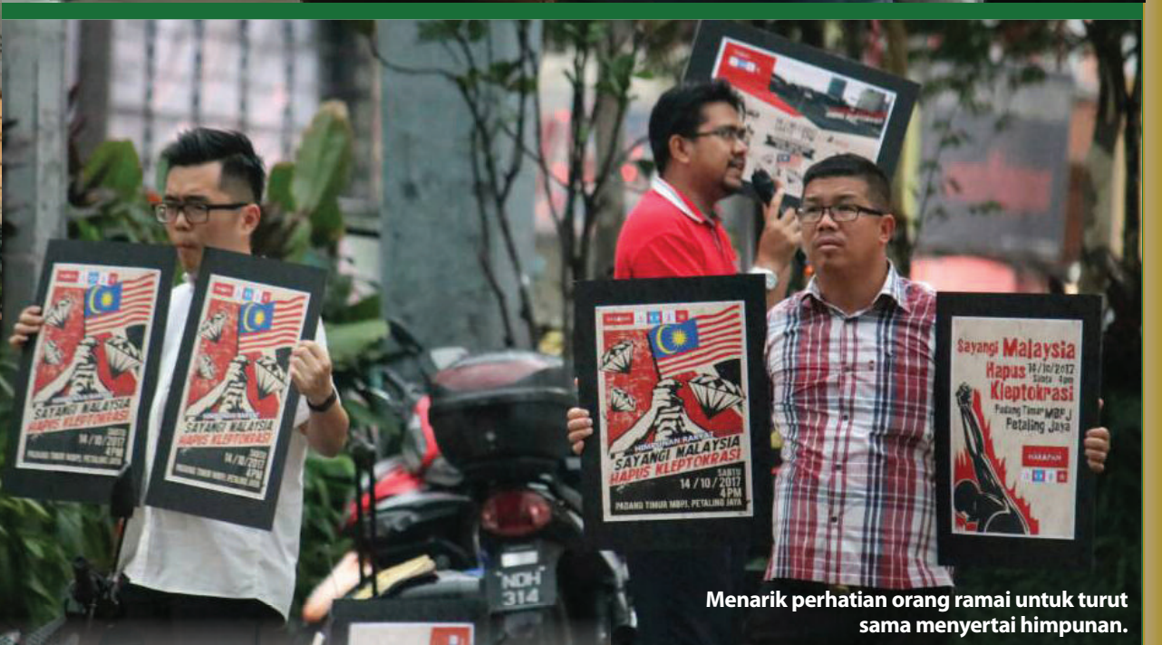
Menarik perhatian orang ramai untuk turut sama menyertai himpunan.