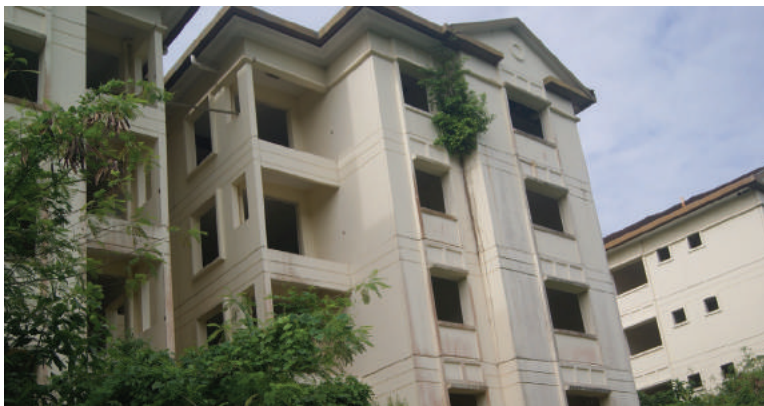
Bangunan kuarters guru yang terbiar kini ditumbuhi semak samun.

"Menteri terlibat serta Exco Pendidikan negeri sepatutnya prihatin