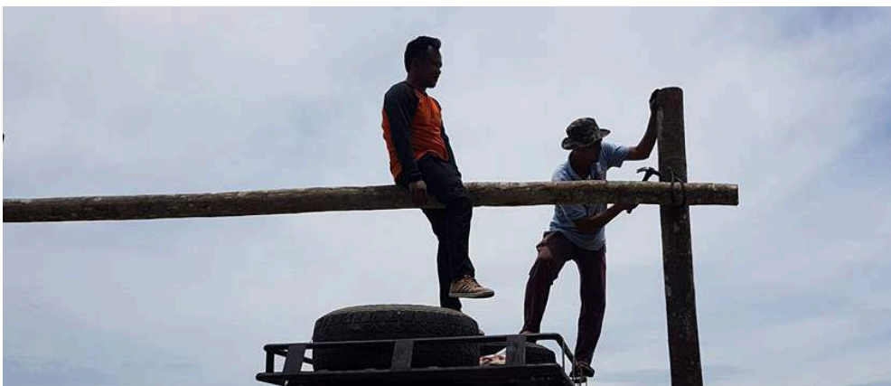
IDEA KREATIF... Pemuda AMANAH Kelantan berjaya menyiapkan tiga unit Buaihan Cinta di Pantai Kubu, Kampung Pulau Kundor di Pengkalan Chepa dalam usaha memperindah pesisir pantai yang sebelum ini terkenal dengan kubu pertahanan penjajah British.