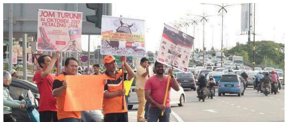
LUASKAN HARAPAN ... Antara peserta aksi kilas anjuran Pemuda Pakatan Harapan Johor yang mengambil bahagian dalam kempen himpunan Sayangi Malaysia di persimpangan lampu isyarat Angsana/LHDN Tampoi ketika waktu puncak petang hari bekerja.