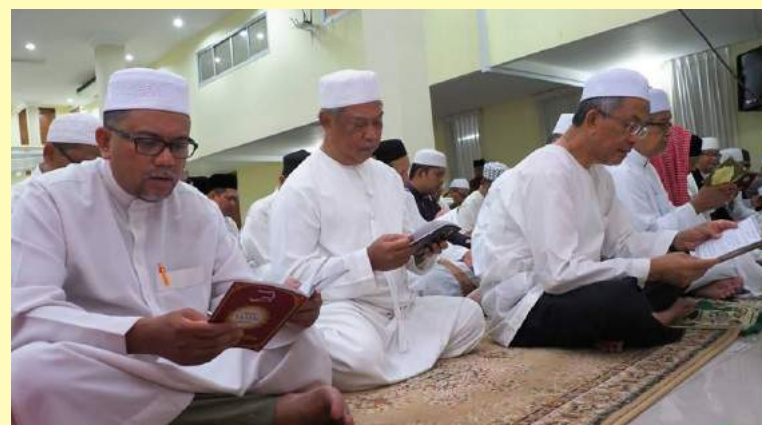
Tan Sri Muhyiddin turut hadir membaca Yaasin untuk pembebasan Anwar.

"Jasad saya dalam penjara tetapi roh dan semangat saya berada bersama pejuang di medan perjuangan," kata Anwar.