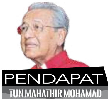
PENDAPAT TUN MAHATHIR MOHAMAD

Ternampak seolah-olah orang Islam menerima pembunuhan murid ini