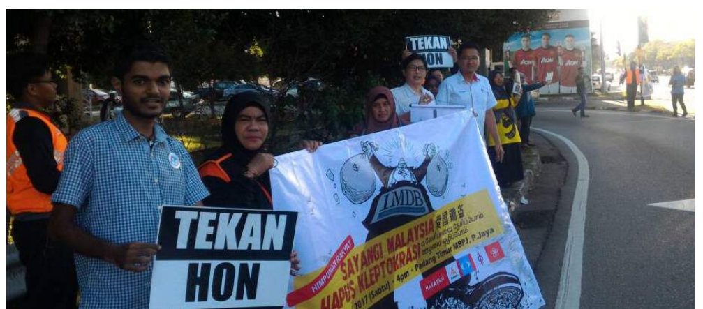
SEMUA ADA... Lokasi sekitar Simpang 4 Melaka Sentral meriah dengan lebih 20 peserta aksi kilas pelbagai kaum yang terdiri daripada Pemuda Pakatan Harapan Melaka. Beberapa anggota ARiF turut mengawal keselamatan.