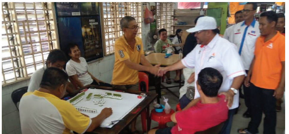
Bertemu masyarakat Tionghoa menjelaskan perkembangan terkini kerajaan Pakatan Harapan negeri.

Program 'Walkabout' yang sepatutnya diadakan di pasar malam Kubang Semang terpaksa dibatalkan kerana hujan lebat, namun ahli rombongan meneruskan