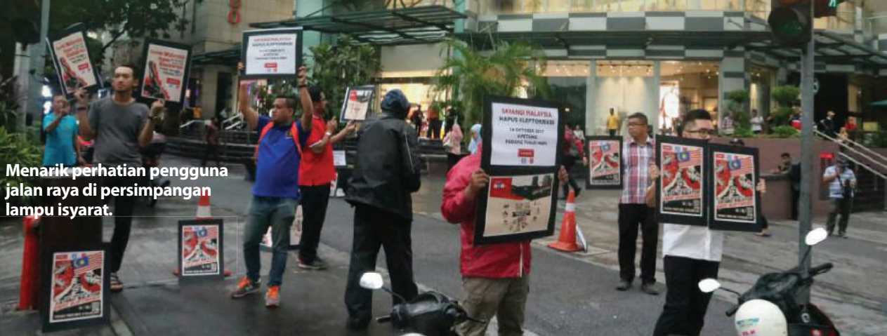
Menarik perhatian pengguna jalan raya di persimpangan lampu isyarat.