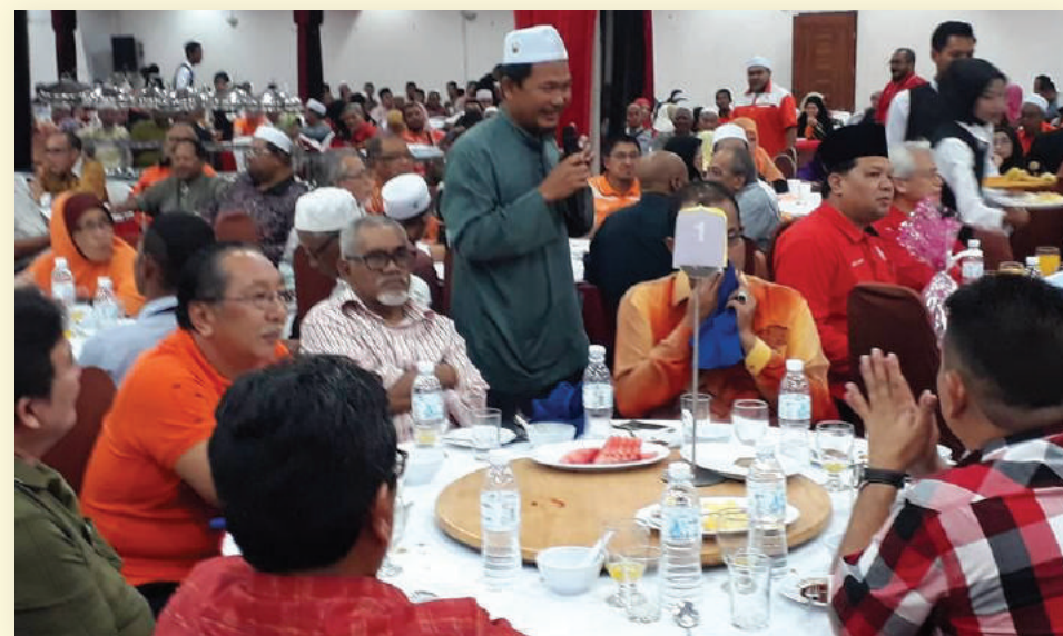
Seorang hadirin bertanyakan soalan pada sesi soal jawab.