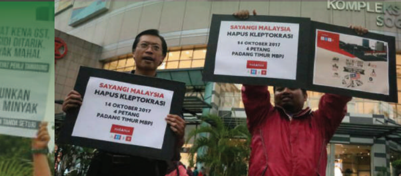
Mempamerkan poster himpunan antikleptokrasi di hadapan pasaraya Sogo, Jalan Tunku Abdul Rahman, Kuala Lumpur.