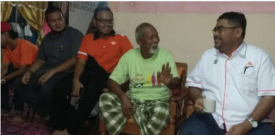
Menziarahi Pak Andak Ad di Kampung Rawa.

PERMATANGPASIR: Siri program Jelajah AMANAH Demi Negara diteruskan dengan acara 'Santai Kopi' di sebuah warung dekat pekan Sama Gagah, baru-baru ini.