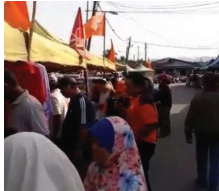
Orang ramai menyerbu Pasar Peduli Rakyat di Taman Sri Nanding, Dusun Tua.

Beliau berharap sumbangan AMANAH ini memberi manfaat kepada masyarakat setempat.