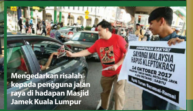
Mengedarkan risalah kepada pengguna jalan raya di hadapan Masjid Jamek Kuala Lumpur