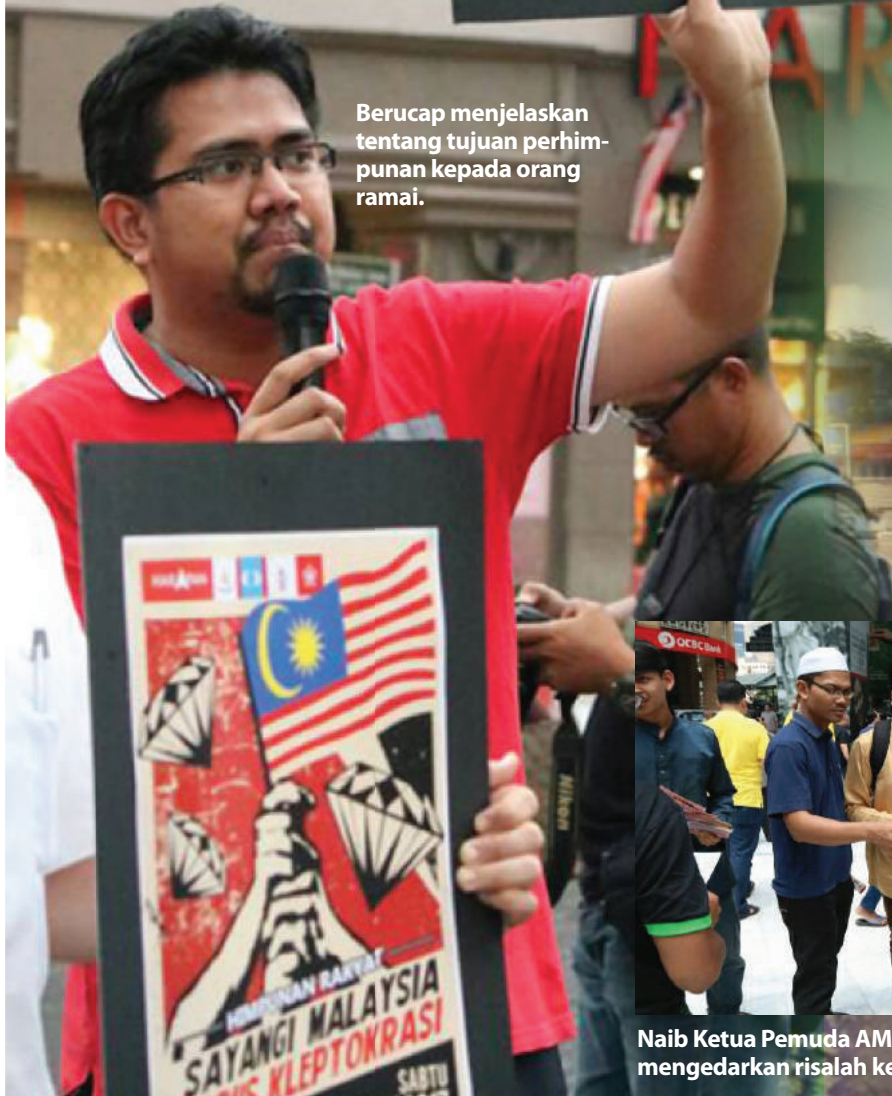
Berucap menjelaskan tentang tujuan perhimpunan kepada orang ramai.