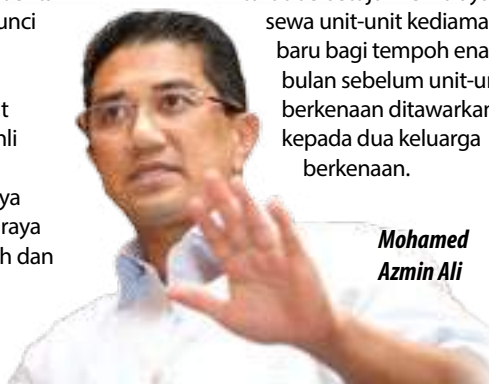
Mohamed Azmin Ali

Pada masa sama, Kerajaan Negeri turut bersetuju membiayai kos sewa unit-unit kediaman baru bagi tempoh enam bulan sebelum unit-unit berkenaan ditawarkan kepada dua keluarga berkenaan.