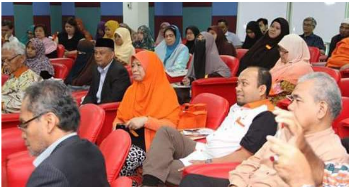
Antara peserta di Dewan Auditorium IDE, Shah Alam.