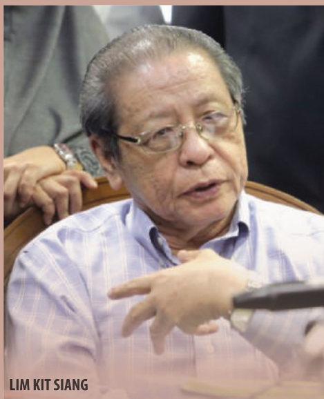
LIM KIT SIANG

Menurut Ahli Parlimen Gelang Patah itu, Annuar dan jentera propaganda Umno membuat anggapan demikian atas dakwaan kononnya DAP memiliki ahli parlimen paling ramai dalam kalangan parti komponen Pakatan Harapan.