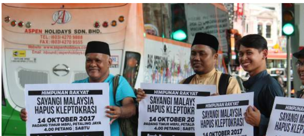
NYARING HON... Aksi kilas Hapus Kleptokrasi oleh Pemuda AMANAH Wilayah Persekutuan berdekatan Masjid Jamek menjelang himpunan di Petaling Jaya disambut nyaring sahutan hon sebagai tanda sokongan daripada sebahagian pemandu.