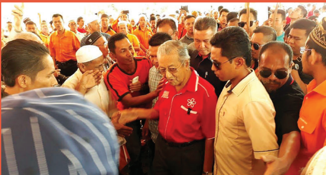
Ketibaan Tun Mahathir disambut meriah.