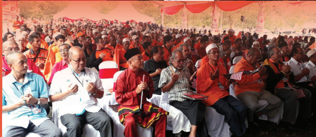
Mengaminkan doa di majlis pelancaran PH Kelantan.