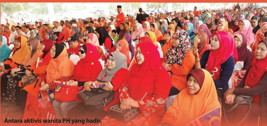
Antara aktivis wanita PH yang hadir.