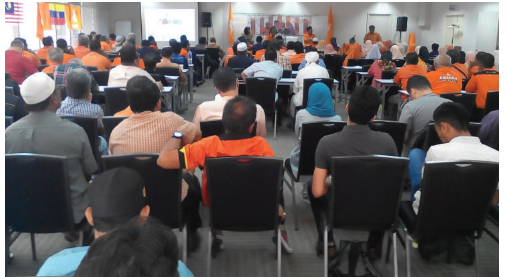
Dewan TKP Central Plaza di Jalan Sultan Ismail dipenuhi perwakilan dan pemerhati sempena Konvensyen AMANAH Wilayah Persekutuan.

Dalam hal berkaitan, Presiden Pas Datuk Seri Abdul Hadi Awang dalam wawancara sebanyak dua muka surat di akhbar Berita Berita Harian edisi Ahad menguar-uarkan kekuatan partinya yang membentuk blok ketiga bersama Parti Ikatan Bangsa Malaysia (Ikatan).