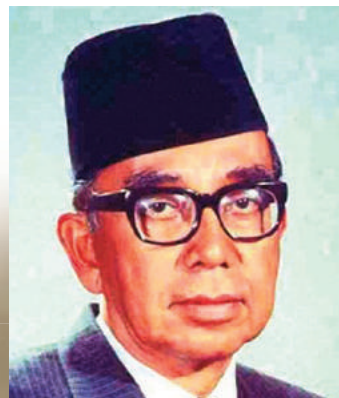
Tun Abdul Razak, andai kata masih bernafas, pastinya pada hari ini akan kecewa dan ralat, kata Raja Nazrin.