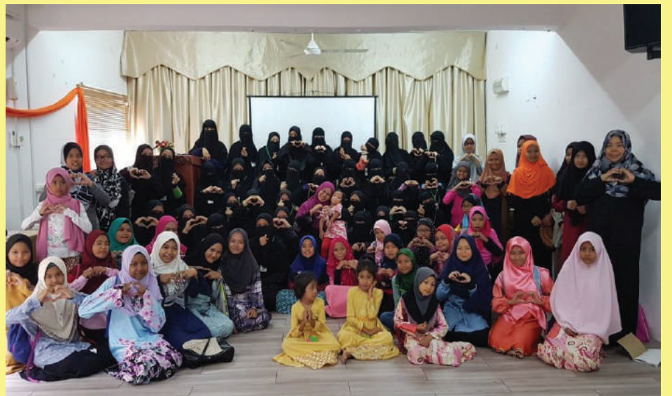
Bergambar ramai bersama pemimpin AWAN seusai program.

Tambah beliau lagi, program ini penting bagi memberi garis panduan kepada anak remaja puteri akan kewajipan dan larangan yang mereka perlu patuhi bagi