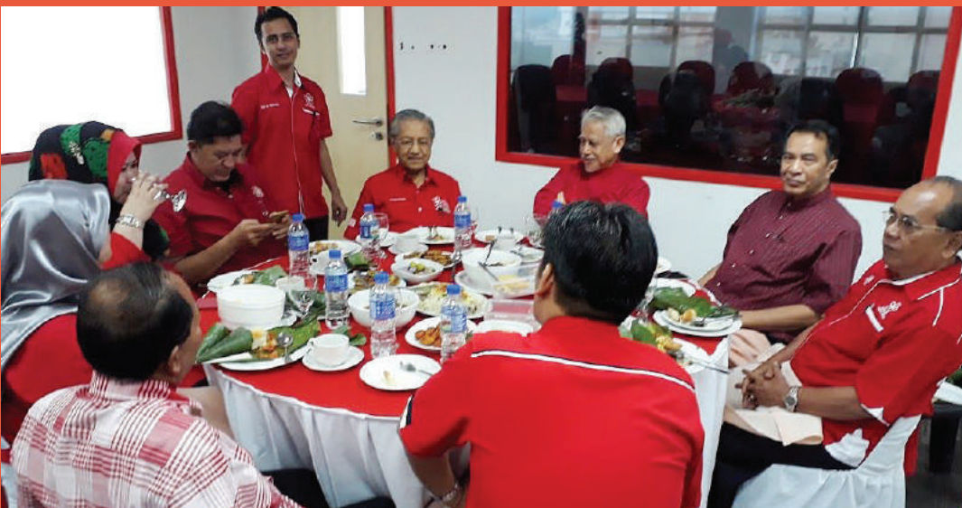
Pemimpin PH bersarapan pagi di Pejabat PPBM Kota Bharu.