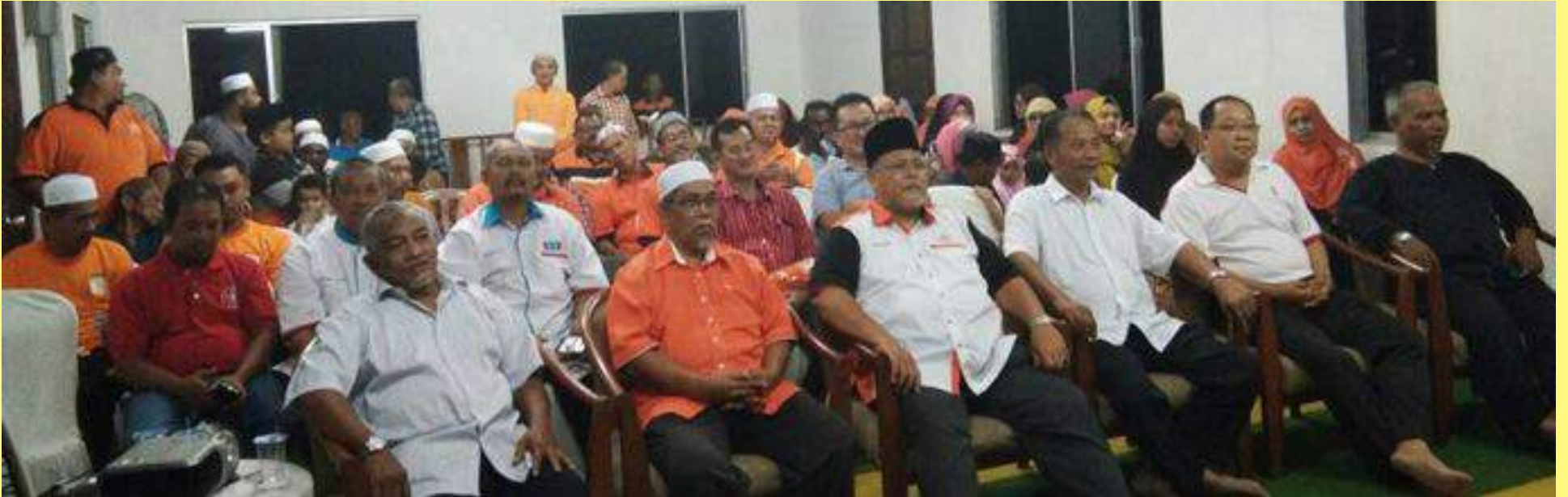
Wakil parti-parti komponen Pakatan Harapan dan sebahagian perwakilan yang menghadiri mesyuarat agung AMANAH Kawasan Sri Gading.