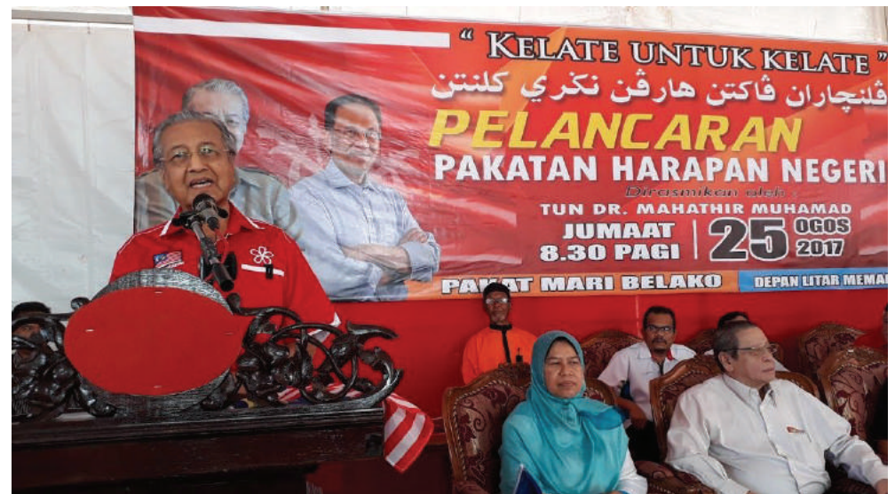
Tun Mahathir berucap pada majlis pelancaran PH Negeri Kelantan di Machang.

negara Najib seorang. Kerajaan kleptokrasi memang mahu rakyat dipaksa tunduk tanpa soal kepada pemerintah.