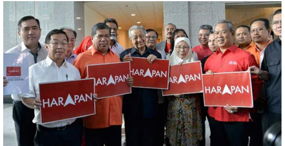
Gabungan pembangkang yang kuat akan meningkatkan keyakinan pengundi kepada Pakatan Harapan.

sangat memberi harapan yang menggunung kepada Pakatan Harapan yang dianggotai oleh PKR, DAP, AMANAH dan Bersatu bagi mengambil