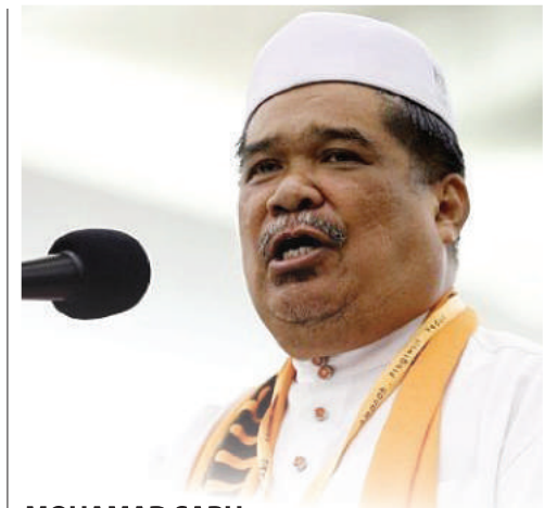
MOHAMAD SABU Presiden Parti Amanah Negara