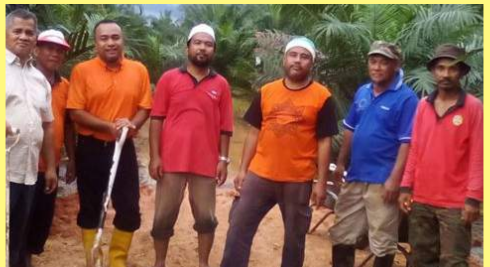
Antara petugas yang berkhidmat menambak benteng bagi menghalang air banjir memasuki perkarangan rumah penduduk.