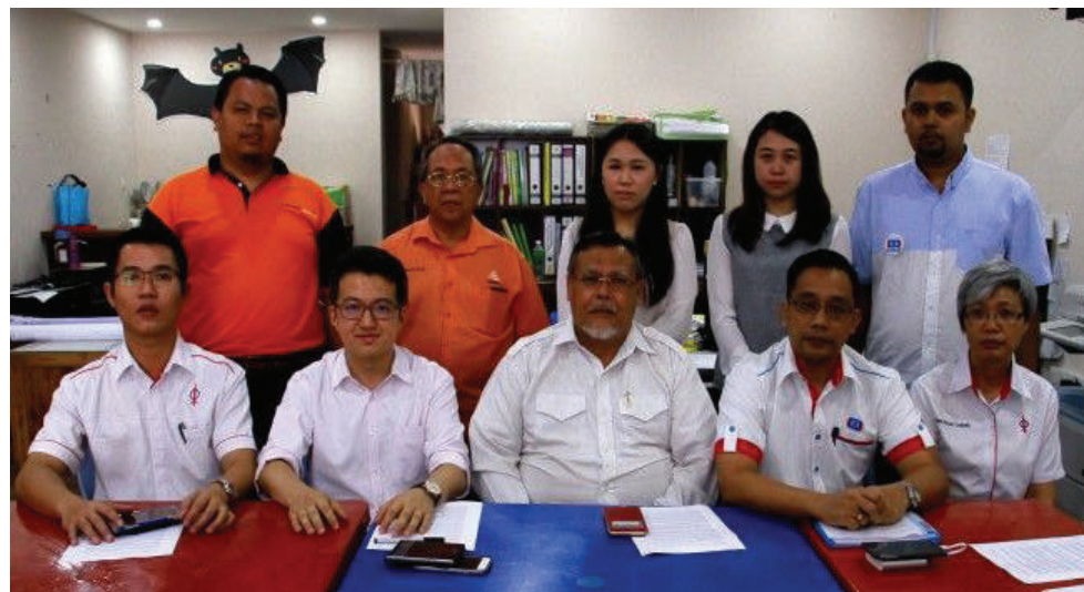
Pakatan Harapan mampu mencipta perubahan politik di Johor.

Hanya pada 14 Julai suasana berubah setelah pengumuman rasmi struktur pimpinan Pakatan Harapan dan berakhirnya dua dekad perseteruan politik antara Datuk Seri Anwar Ibrahim dan Dr Mahathir serta penyokong kedua-duanya yang berbaik semula untuk menyelamatkan negara.