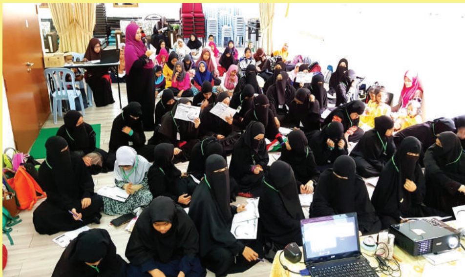
Peserta menjalankan aktiviti berkumpulan.

SENAWANG: Menyedari golongan remaja adalah aset penting negara ini, Angkatan Wanita Amanah (AWAN) Negeri Sembilan telah menganjurkan Program Untukmu Puteri Kesayangan, dekat sini, 27 Ogos lalu.