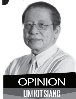
OPINION LIM KIT SIANG

Seri Anwar Ibrahim as the Pakatan Rakyat Prime Minister-designate in the 13GE campaign. When the issue was forced in 2014, Hadi declared his opposition to the PKR President, Datuk Seri Dr. Wan Azizah Wan Ismail as the PR Selangor Menteri Besar.