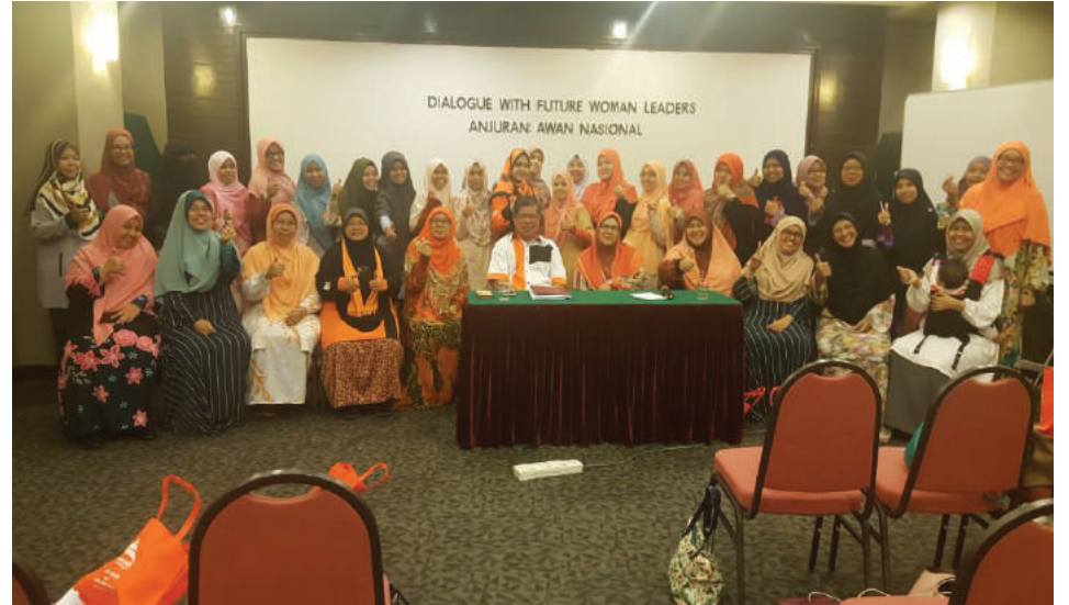
Peserta dan pemimpin bergambar ramai seusai majlis.

dalam menangani cabaran sebagai aktivis dan juga pada masa yang sama tidak mengabaikan tanggung jawab sebagai isteri dan ibu.