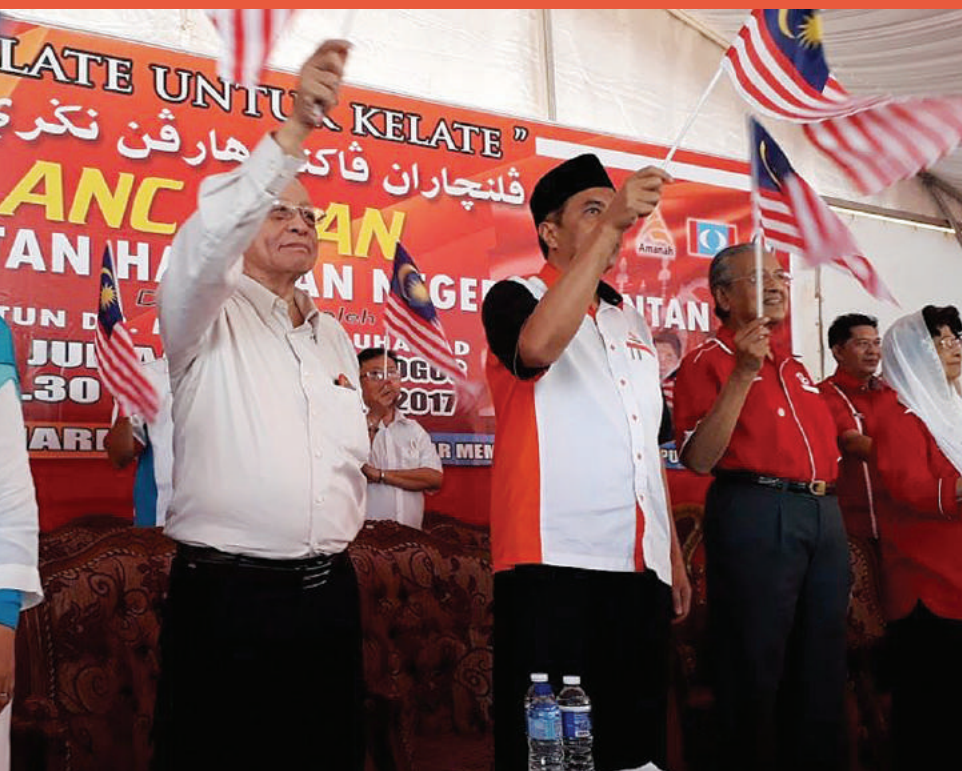
nilang sambil menyanyikan lagu patriotik.