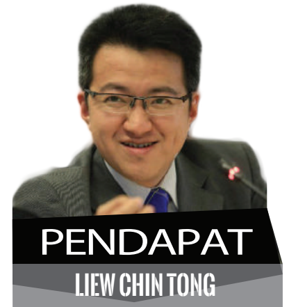
PENDAPAT LIEW CHIN TONG