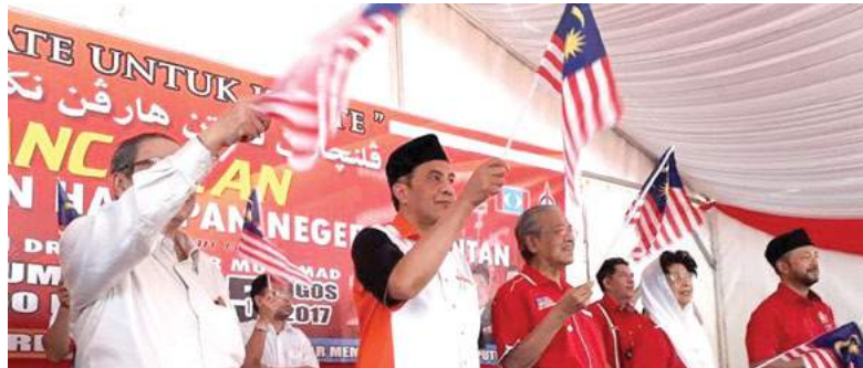
Selamat Hari Merdeka... Pemimpin PH mengibarkan Jalur Gemilang ketika majlis perhimpunan mereka di Kelantan baru-baru ini.

Kenyataan itu ditandatangani oleh Dr Mahathir, Presiden PH Datuk Seri Dr Wan Azizah Wan Ismail; Timbalan