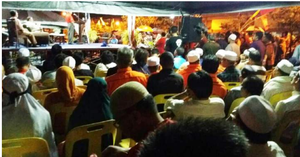
Orang ramai mendengar ceramah Tun Dr Mahathir di Kuala Terengganu 26 Ogos lepas.