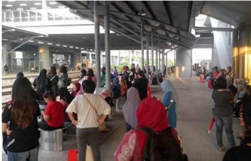
Pengguna komuter di stesen Sungai Buloh baru-baru ini terkandas lebih empat jam.

"Suasana hiruk-pikuk macam baru keluar stadium tengok Sukan SEA. Ada yang mahu naik ETS balik ke Ipoh kata tunggu lebih tiga jam tren tidak sampai-sampai," kata Azuan menggambarkan suasana di stesen KTM Sungai Buloh pada petang 23 Ogos lalu.