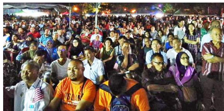
Orang ramai yang memenuhi tempat ceramah.

Turut berceramah malam itu ialah Presiden Pakatan Harapan Datuk Seri Wan Azizah Wan Ismail.