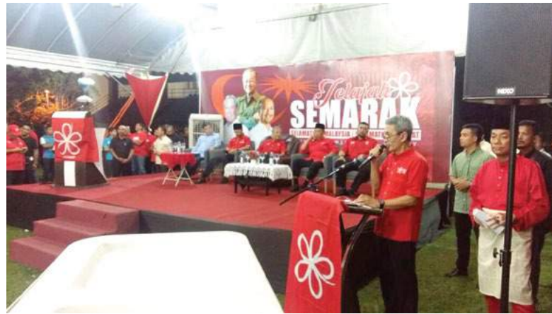
Tun Mahathir dan para pemimpin Pakatan Harapan di pentas utama.

cukai. Ini kali pertama kita ada cukai semacam itu tapi tidak cukup. Sekarang ini siapa naik kapal terbang kena bayar seringgit," ujarnya.