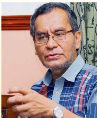
Dr Dzulkefly Ahmad