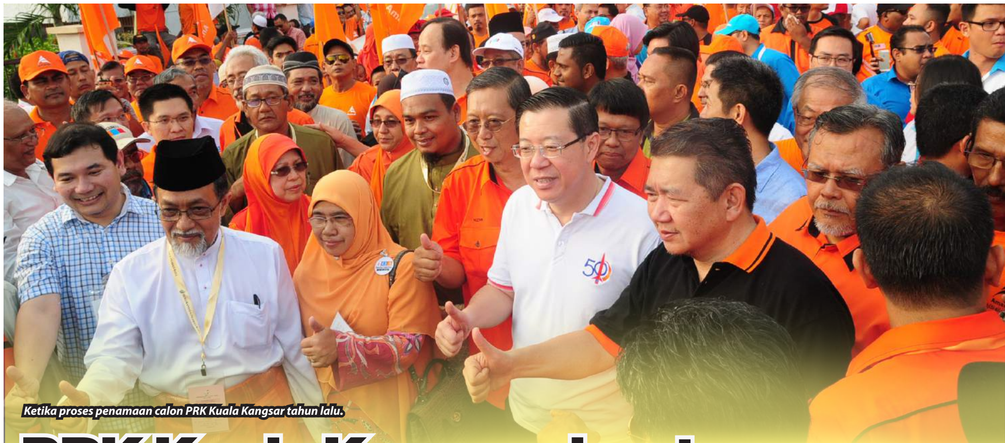
Ketika proses penamaan calon PRK Kuala Kangsar tahun lalu.