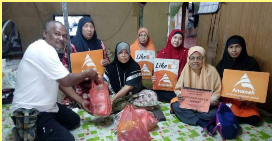
Program Salam Jumaat diadakan pada setiap minggu di rumah ahli yang berbeza.

Selain itu, program Ziarah Mahabah pula diadakan bertujuan menziarahi tokoh-tokoh almalak dan orang sakit, OKU, ibu tunggal, orang