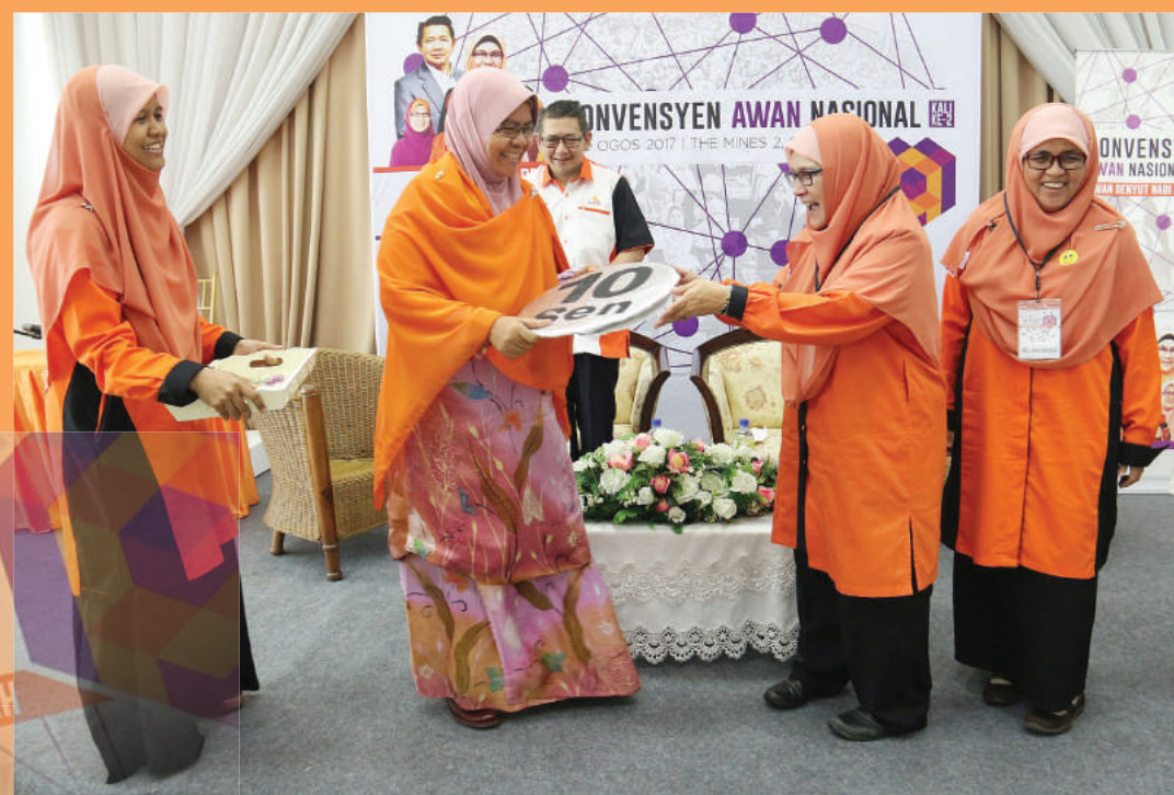
Dr Mariah melancarkan program kutipan derma AWAN Nasional, AWAN SH 10 sen.