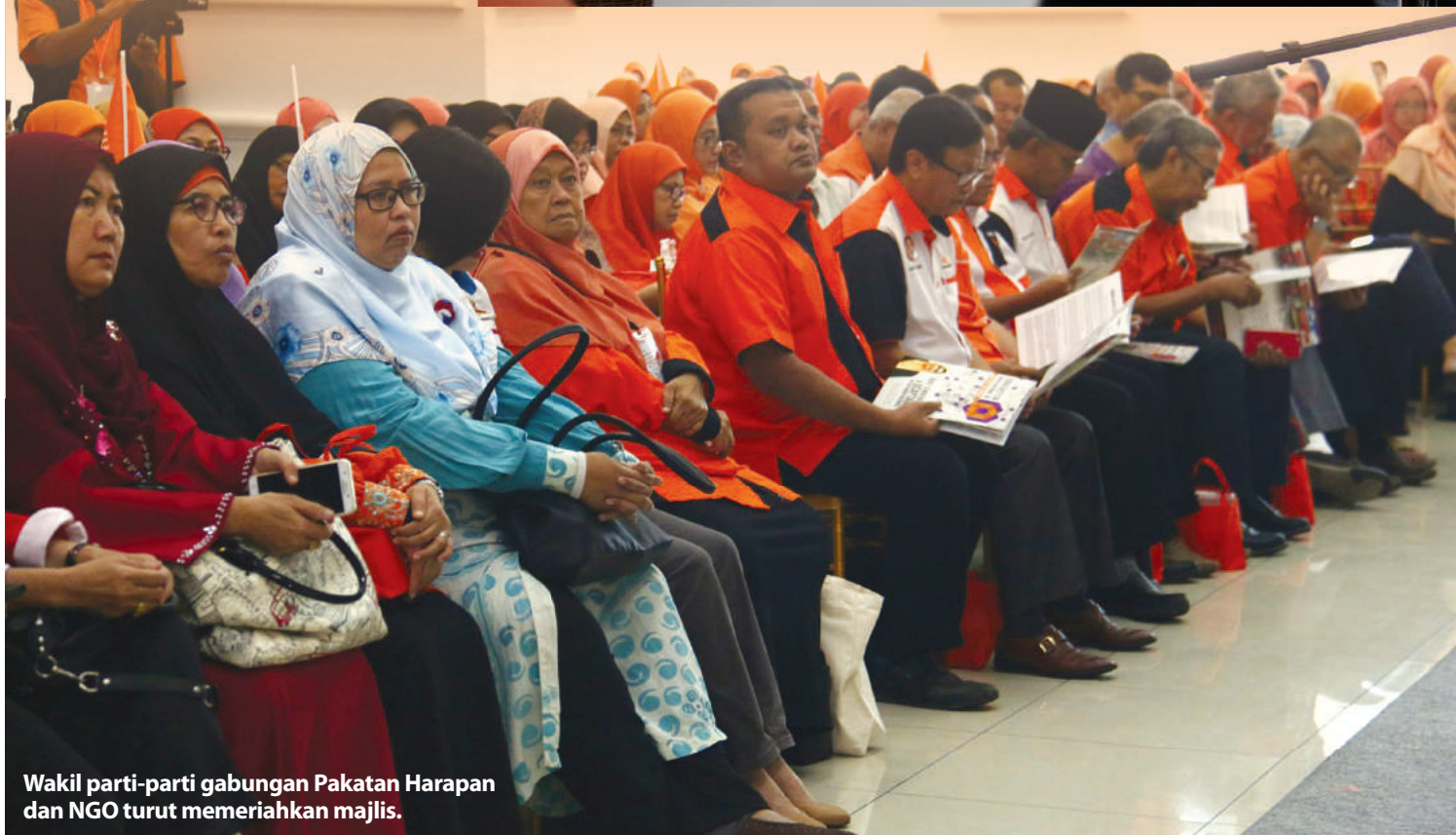
Wakil parti-parti gabungan Pakatan Harapan dan NGO turut memeriahkan majlis.