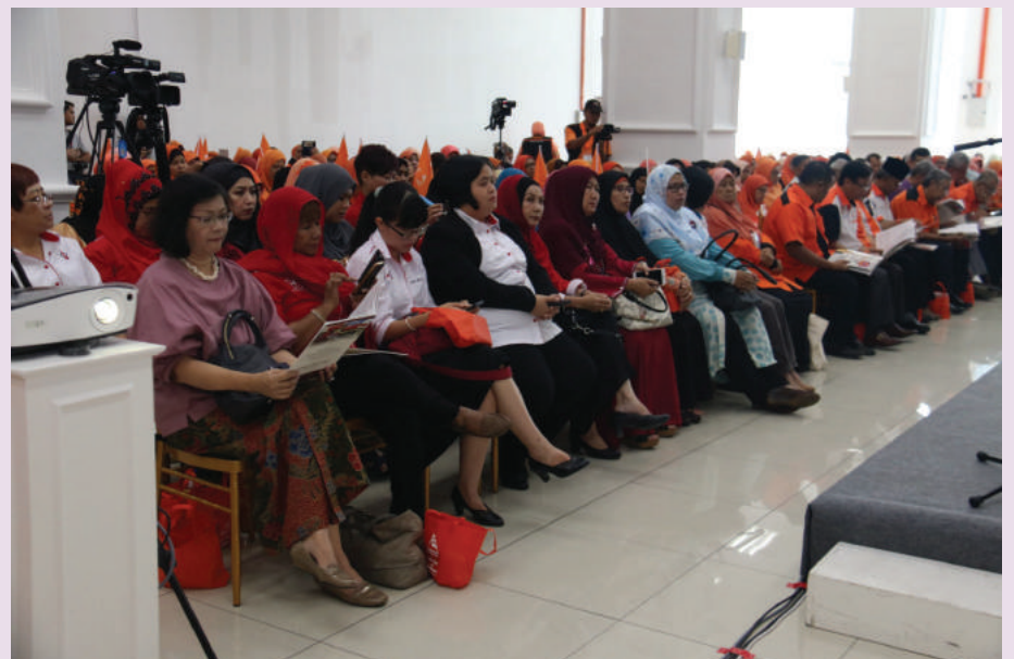
Antara dif jemputan yang hadir pada majlis perasmian Konvensyen AWAN Nasional.