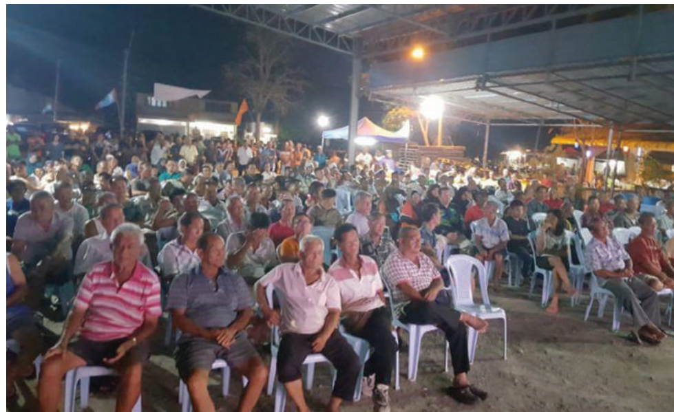
Sebahagian orang ramai yang membanjiri Dataran Harapan di Tanjung Piandang bagi mengikuti ceramah PH.

"Zaman Tun Mahathir jadi Perdana Menteri, harga barang naik tidak setinggi ini, pendapatan orang kampung pun boleh tumpang," katanya.