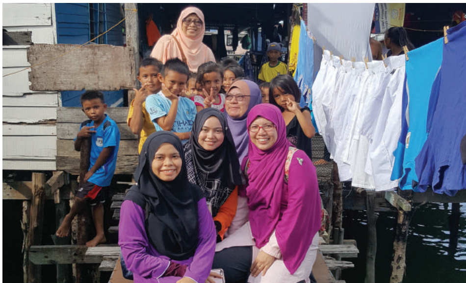
Mengunjungi perkampungan air di sekitar Batu Sapi.

AWAN Nasional juga turut menyalurkan sumbangan berupa barangan dapur kepada 30 keluarga asnaf di sekitar Parlimen Batu Sapi.