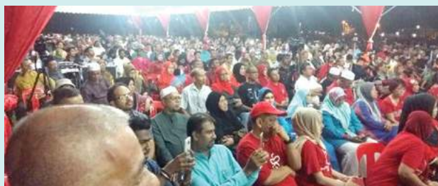
Orang ramai yang membanjiri tapak ceramah di padang Kompleks Sukan Bertam.

Menurut Mukhriz, apa yang lebih pelik apabila persidangan agung Umno bahagian di Kedah baru-baru