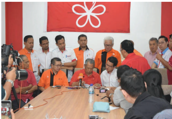
Muhyiddin meneliti senarai kepimpinan PH Johor sebelum melakukan pengumuman.