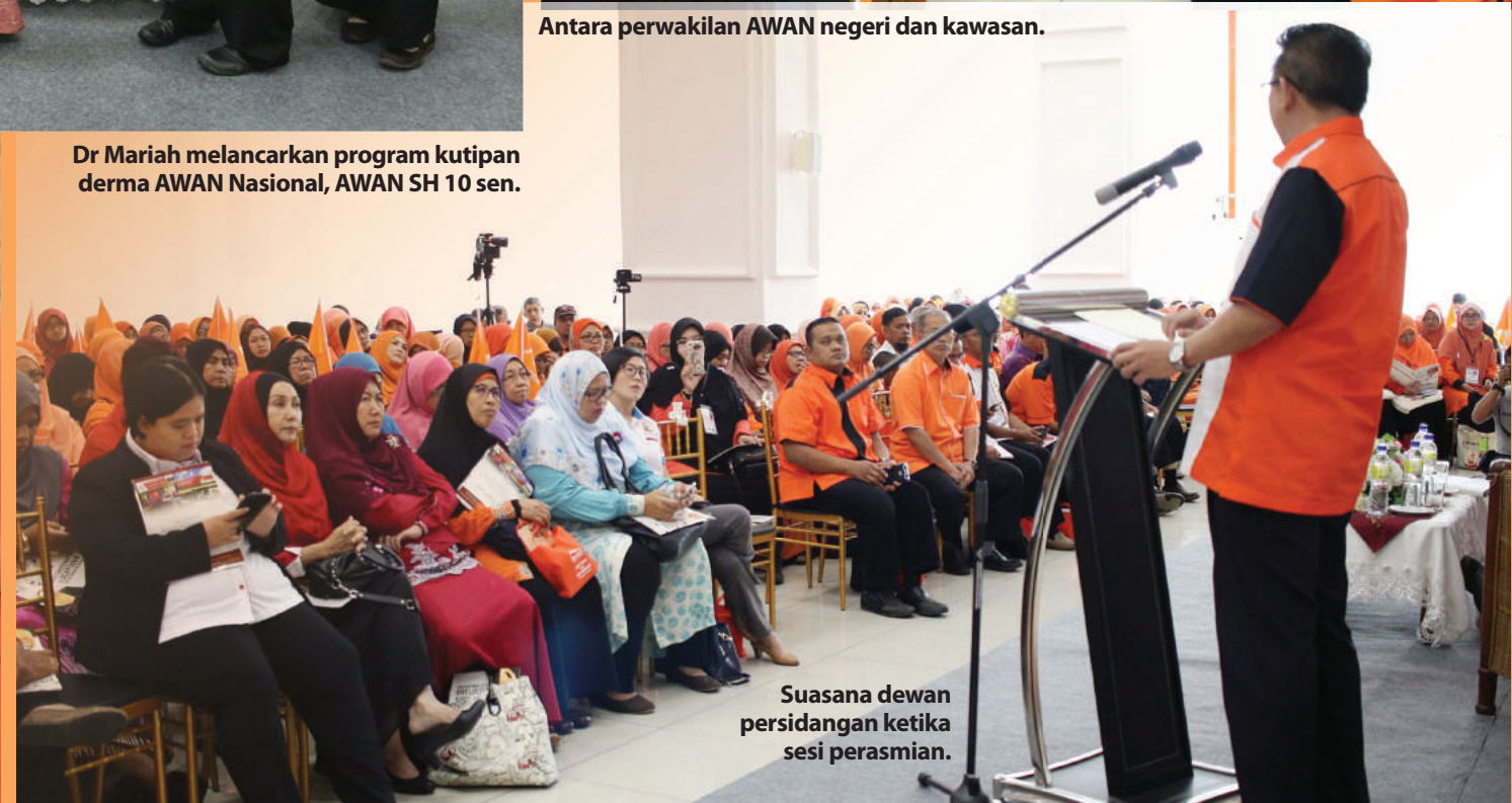
Suasana dewan persidangan ketika sesi perasmian.