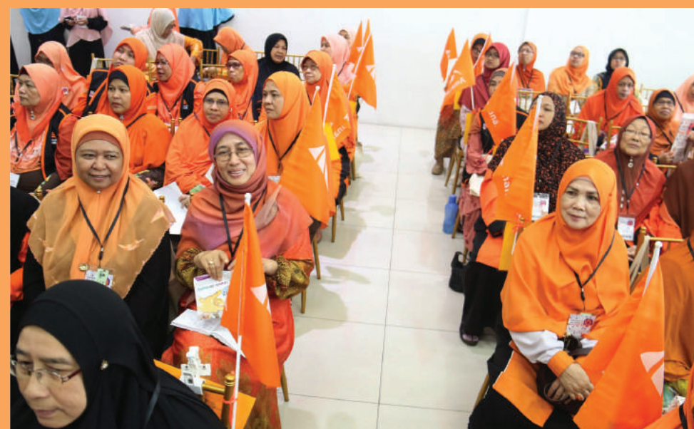
Antara perwakilan AWAN negeri dan kawasan.