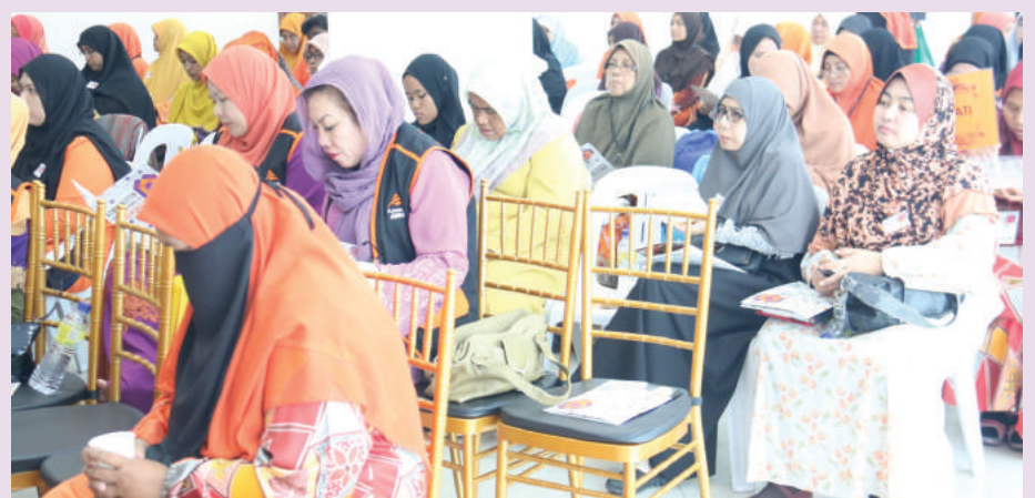
Antara perwakilan AWAN negeri yang tekun mengikuti konvensyen.

"Tugas mengajar dan mendidik (membentuk akhlak) hanya mengambil 30 peratus daripada tugas hakiki mereka," menurut usul itu.