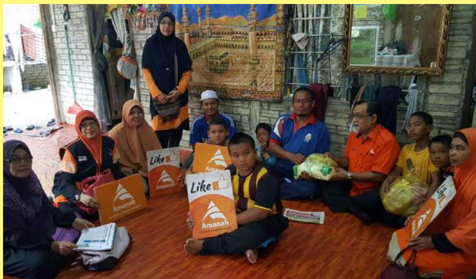
AMANAH sentiasa turun padang bertemu dengan masyarakat yang memerlukan.