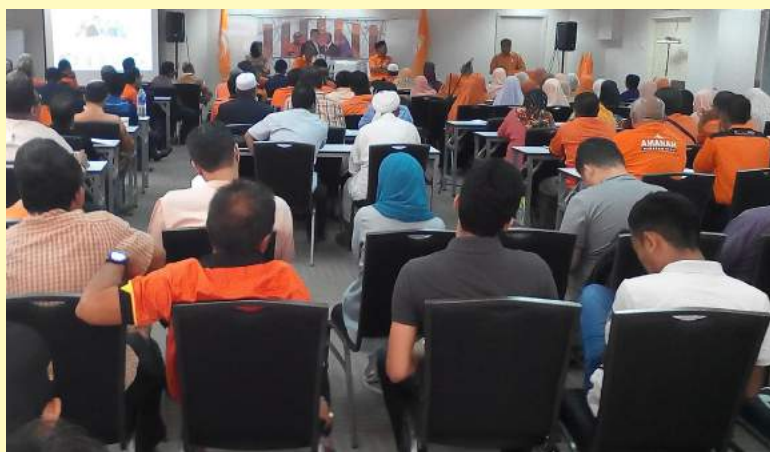
Mohamad Sabu berucap merasmikan Konvensyen AMANAH Wilayah Persekutuan.

Bulan lalu, Menteri Wilayah Persekutuan, Datuk Seri Tengku Adnan Tengku