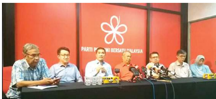
Azmin menjawab soalan pemberita dalam sidang media PH di Petaling Jaya.

“ Kita nanti akan memantau persiapan itu dan akan menghantar pasukan-pasukan untuk membuat penaksiran tentang sejauh mana persiapan itu telah dibuat, apakah kelemahan, dan usaha penambahbaik yang perlu dilakukan,”