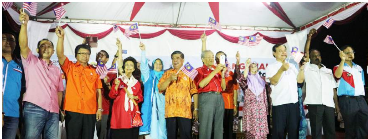
Tun Mahathir bersama pemimpin Pakatan Harapan serta orang ramai mengibarkan bendera mengiringi lagu Jalur Gemilang.

gan terhadap skandal 1MDB melibatkan kerajaan BN yang masih belum selesai walaupun sudah mendapat liputan di peringkat antarabangsa.