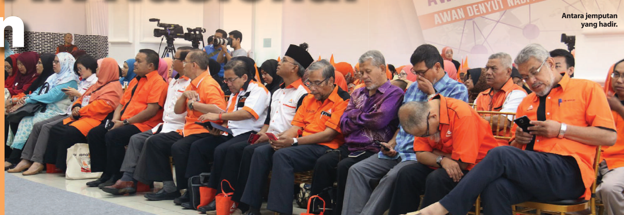
Antara jemputan yang hadir.