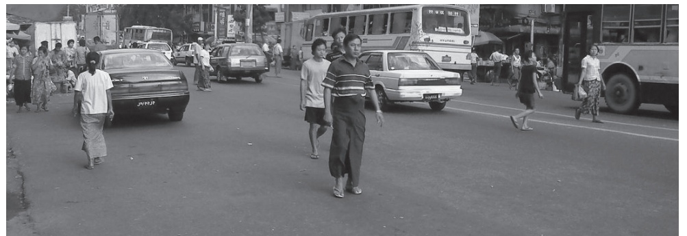
Suasana di Kota Yangon