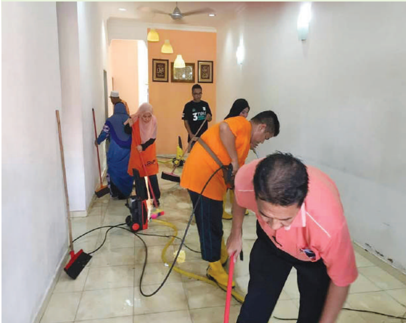
Membantu membersihkan rumah penduduk di Taman Bukit Beruang.