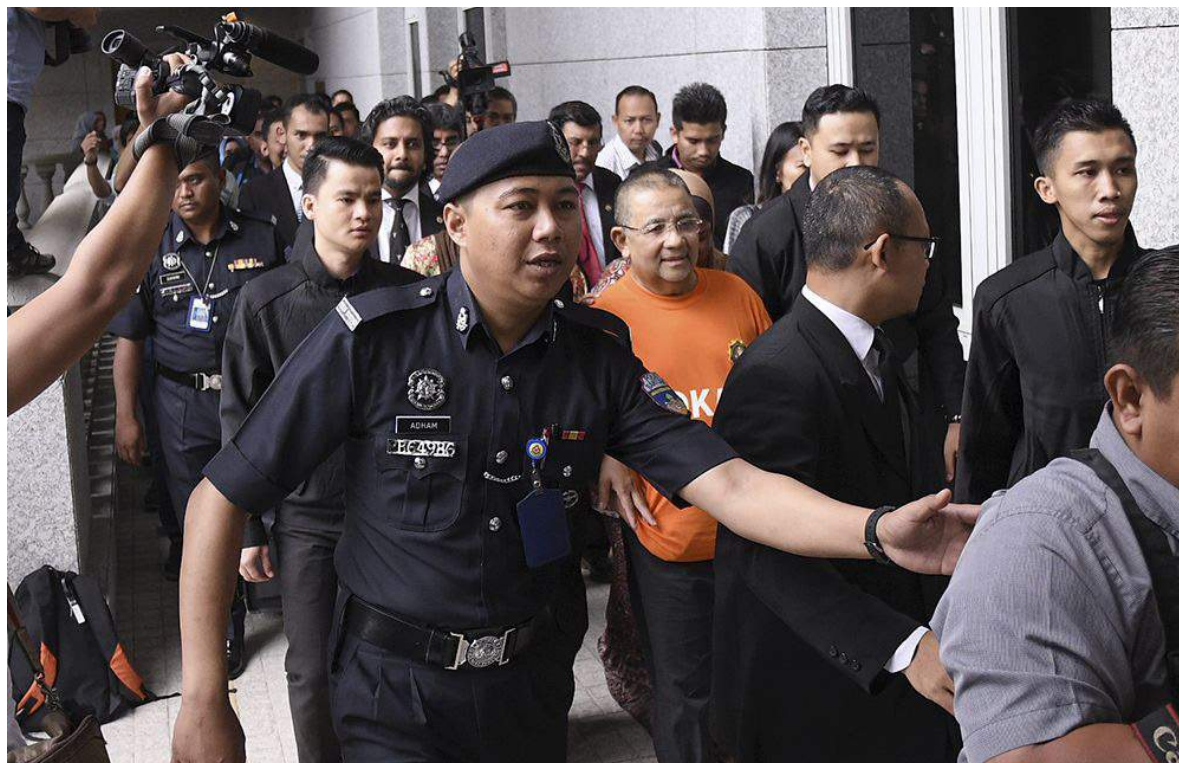
Tan Sri Isa Samad ketika dibawa ke mahkamah.

PKR pula bimbang kalau-kalau Isa adalah ulangan kepada tindakan terhadap