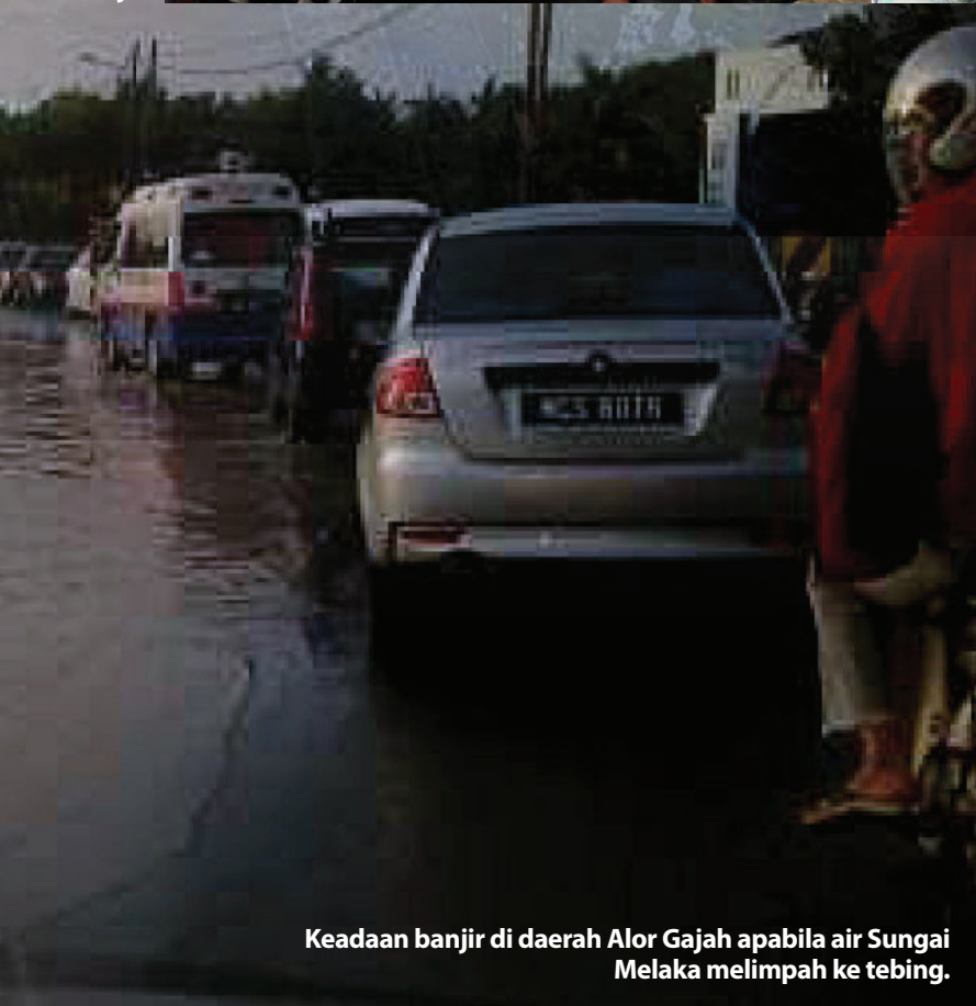
Keadaan banjir di daerah Alor Gajah apabila air Sungai Melaka melimpah ke tebing.

Usaha yang sedikit ini diharap dapat meringankan beban mangsa banjir dan menyerlahkan sikap inklusif dan peduli AMANAH.