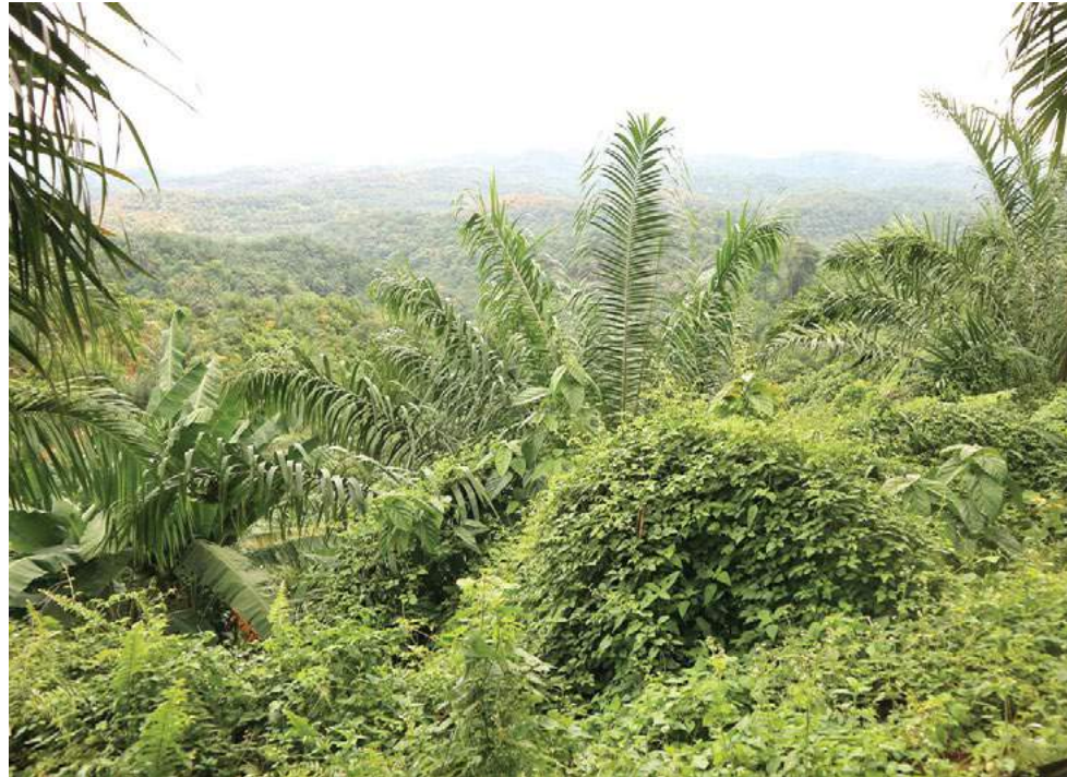
Tumbuhan liar memanjat pokok sawit bukti kegagalan pihak Felda mengurus kebun peneroka.

Tidak hairanlah siasatan Amanah dengan kerjasama Media Oren dan dipandu sekumpulan peneroka Felda Trolak Timur pada 6 Ogos lalu mendapati bilangan pokok sawit yang kekuningan daunnya agak ketara akibat