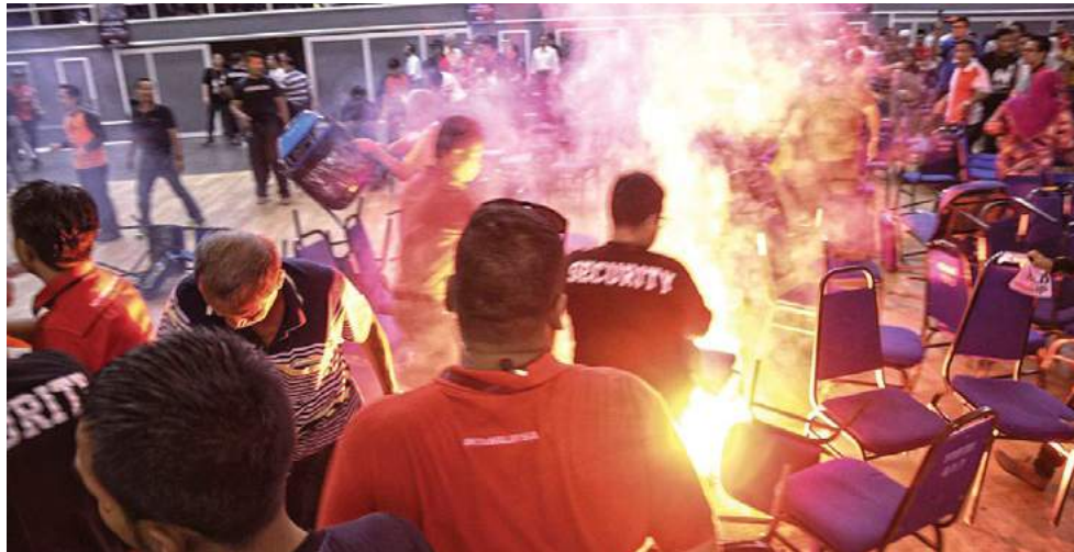
Kekecohan yang dibuat di program 'Nothing to hide' tidak patahkan semangat Tun Dr Mahathir.

Polis Selangor yang diketuai oleh polis Shah Alam sedang menyemak gambar-gambar dan rakaman video untuk mengenal pasti identiti anggota lain kumpulan itu. Tiga remaja yang