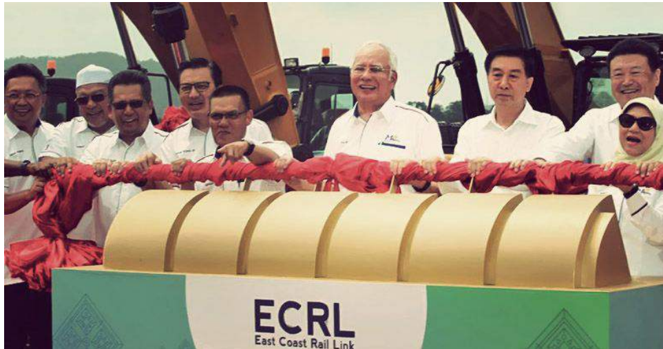
Perdana Menteri, Datuk Seri Najib Razak ketika melancarkan ECRL.

Kos yang pada awalnya dinyatakan sebagai RM30 bilion itu meningkat 83 peratus tanpa tawaran terbuka bagi mendapatkan kos lebih