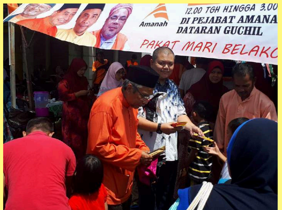
Sambutan Aidilfitri AMANAH Kuala Krai disambut meriah.