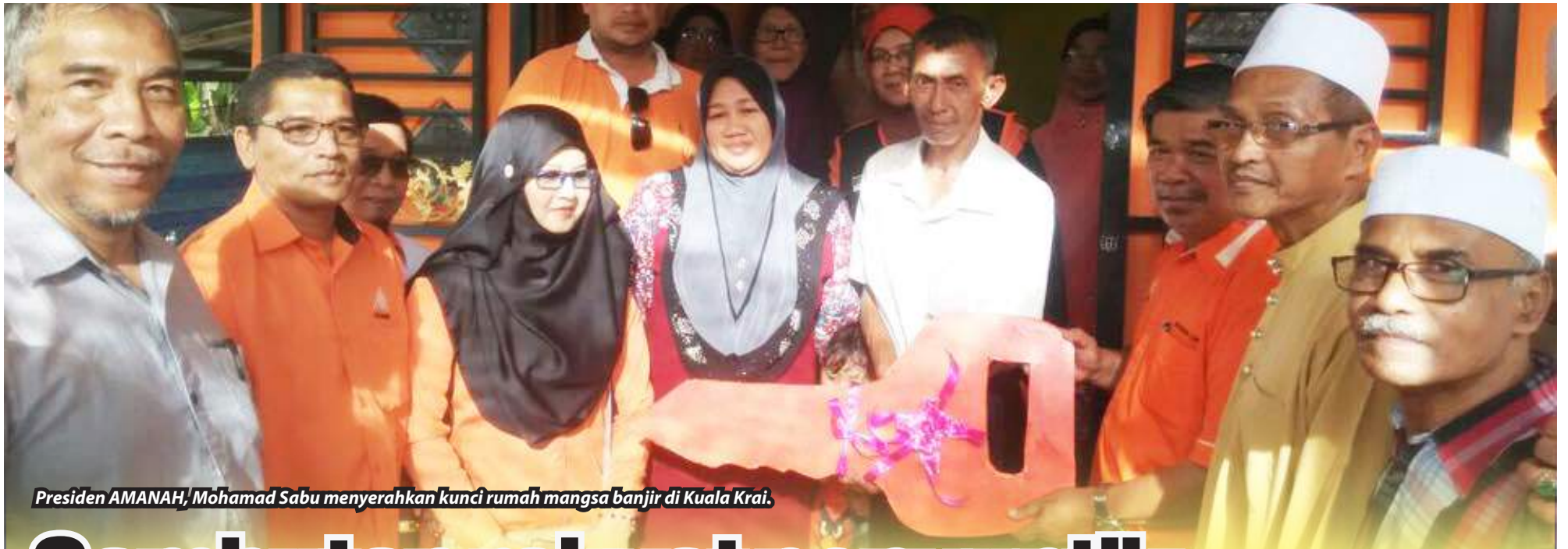
Presiden AMANAH, Mohamad Sabu menyerahkan kunci rumah mangsa banjir di Kuala Krai.