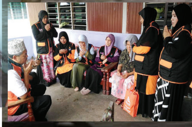
Doa dibaca untuk kesejahteraan keluarga yang ditimpa bencana.