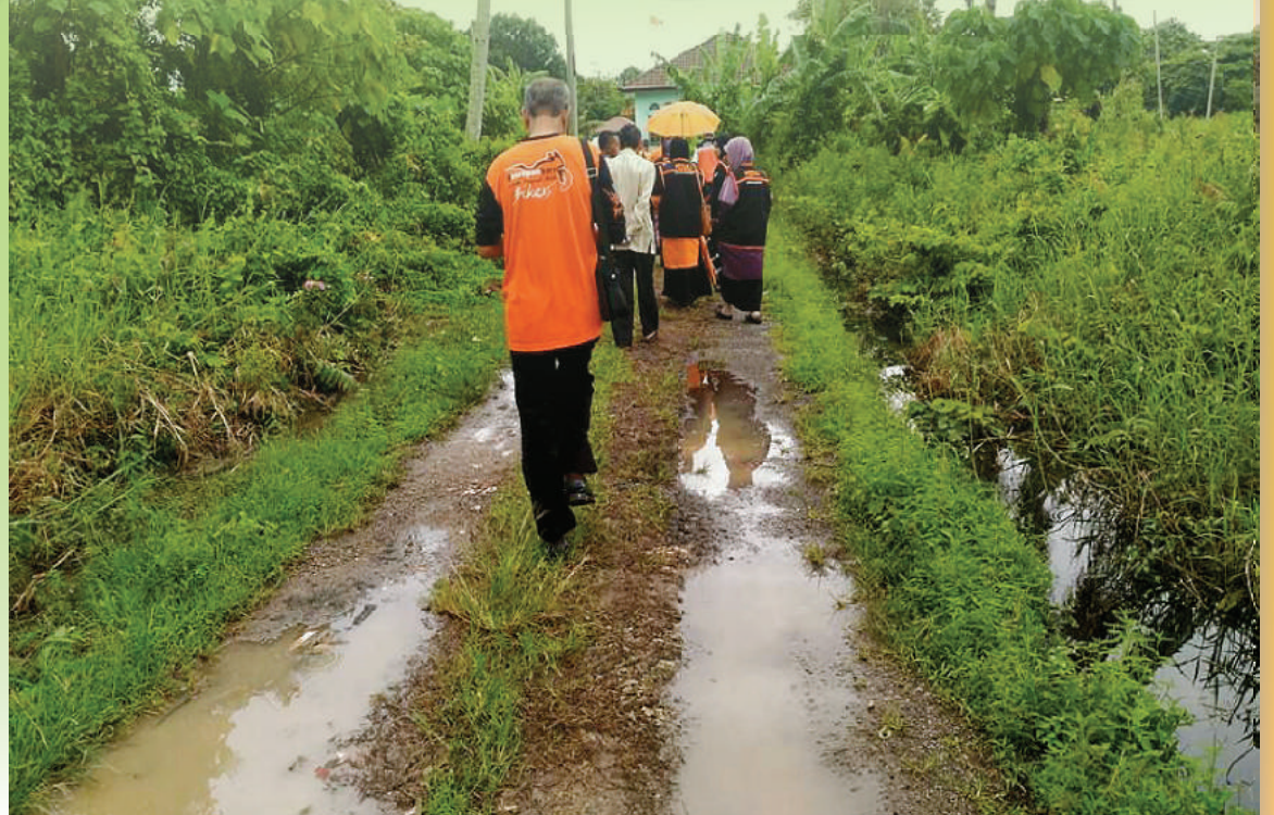
Meredah jalan berlecek sesudah banjir surut.