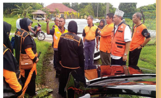
Diberi penerangan oleh seorang penduduk berhubung banjir kilat yang melanda.