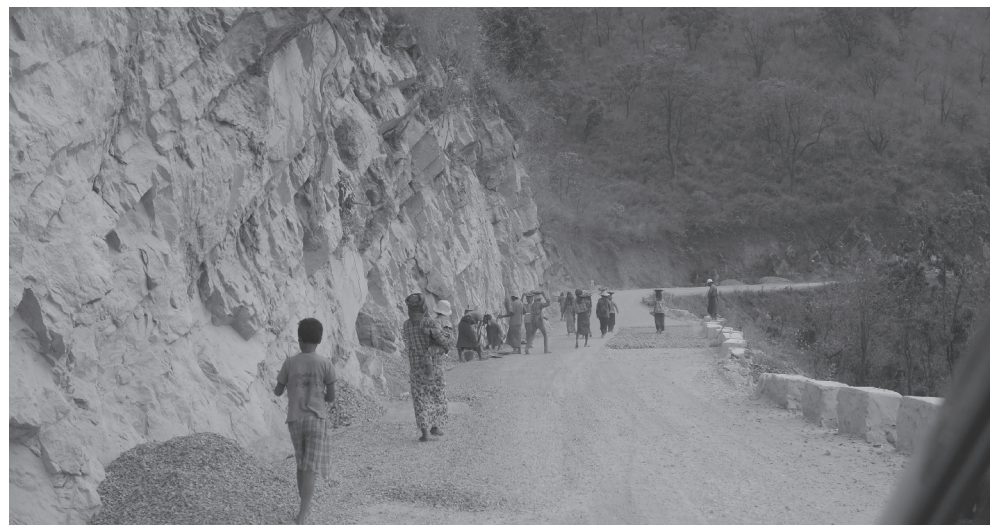
Pemandangan sepanjang perjalanan di Myanmar memaparkan keperitan hidup rakyatnya.

keselesaian jalan raya yang dibina mereka. Diskriminasi oleh masyarakat ini wujud ke atas mereka hanya kerana mereka adalah pelarian ekonomi dari daerah atau negeri lain. Negeri lain, bukan negara lain.