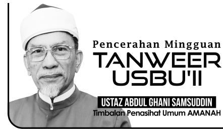
Pencerahan Mingguan TANWEER USBUII

Allah melaknat kaum Bani Is-rael pun adalah kerana sifat mereka suka mengganas dan melakukan pencerobohan, seperti mana yang dijelaskan oleh Allah dalam surah yang sama ayat 78, maksudnya: "Hal itu adalah kerana mereka menderhaka dan mereka melampau batas