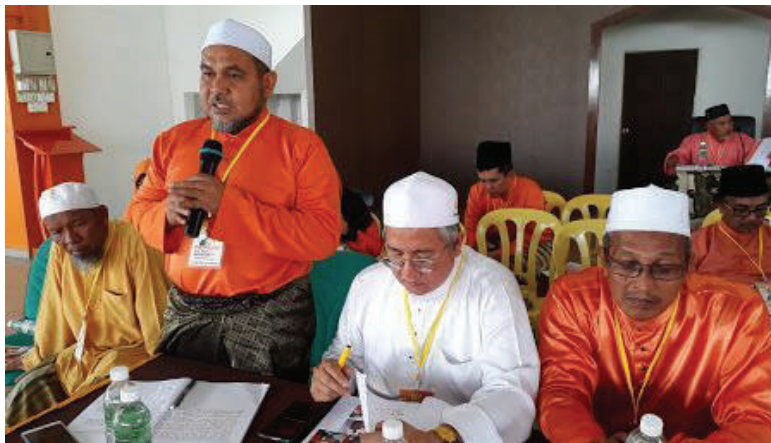
Naib Pengerusi AMANAH Kelantan sedang membentangkan usul di konvensyen AMANAH Kelantan kali ke-2 di Kota Bharu.

Sebab itu katanya pihak pimpinan perlu segera mengadakan tatacara yang jelas bagaimana perkara