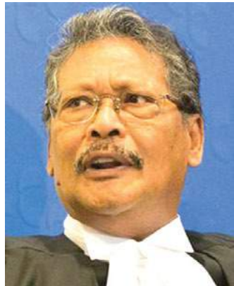
Tan Sri Mohd Apandi Ali

untuk memulakan tindakan undang-undang ke atas sesiapa pun dari perompak dana 1MDB adalah satu tindakan yang seolah-olah cuba untuk mempertahankan perompak wang rakyat. Di mana kredibiliti beliau sebagai seorang peguam negara?" soalnya dalam satu kenyataan media, 6 Julai lalu.