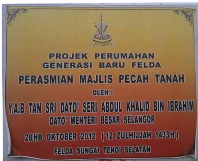
Generasi baharu Felda tertanya-tanya status sebenar projek yang sudah lima tahun dirasmikan.

Syafiq masih ingat lagi betapa berangnya penyoy-