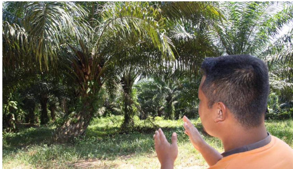
Peneroka kecewa syarat dalam Perjanjian Tanam Semula cenderung menjerat mereka dalam kitaran hutang.

"Kita pun maklum saham FGV jatuh merudum. Apa yang Mazlan bimbangkan dulu ber-