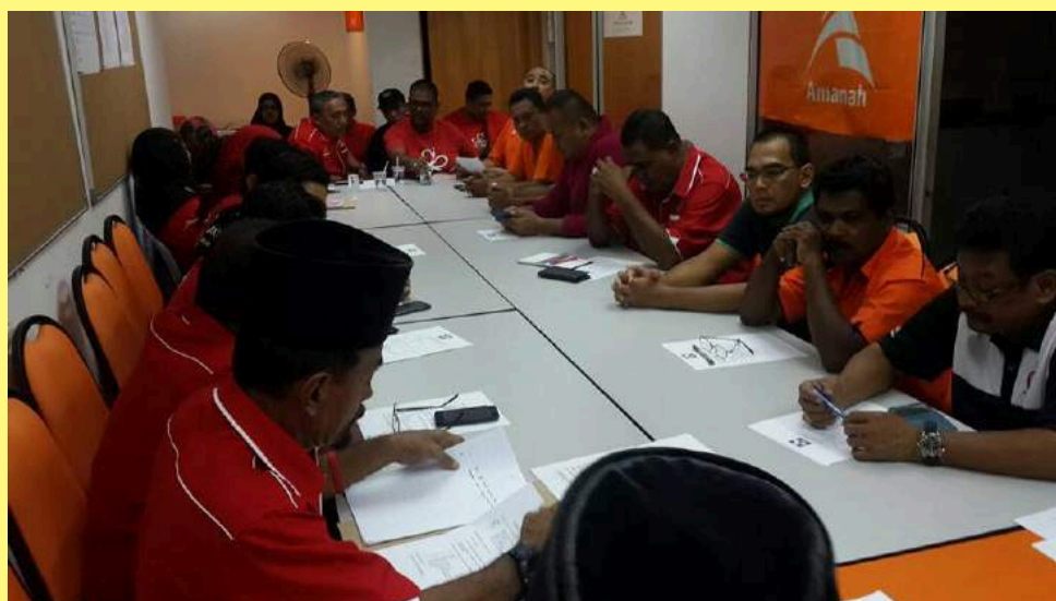
AMANAH dan PPBM kerap bermesyuarat bagi memastikan gerak kerja berjalan lancar.

"Saya selalu jumpa masyarakat di sini, dengar masalah mereka dan mereka tahu Pakatan Harapan serius dalam mendepani isu-isu rakyat," katanya.