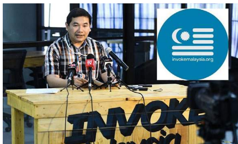
Kempen mengajak orang ramai khususnya anak muda menyertai program Invoke giat dijalankan.

Menurut beliau, walaupun rakyat mengetahui tentang skandal 1MDB namun ia tidak dirasai dan mendatangkan kesan kepada kehidupan mereka.