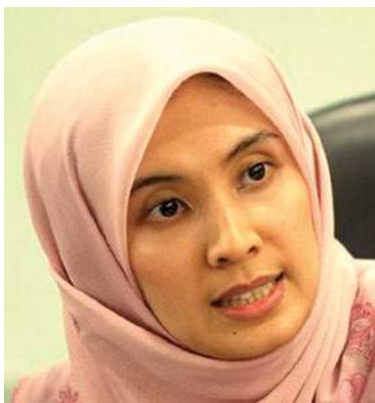
Nurul Izzah Anwar

Panel itu juga memutuskan hakim Mahkamah Tinggi tidak melakukan sebarang kekhilafan yang memerlukan mahkamah rayuan untuk campur tangan.