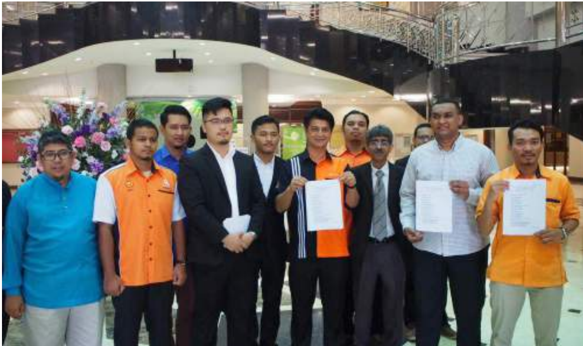
Faiz dan sembilan plaintif lain mewakili GANT1 memfailkan saman ke atas Najib, kerajaan Malaysia dan 1MDB.

Menurut Faiz, GANT1 menyifatkan langkah konkrit perlu diambil untuk