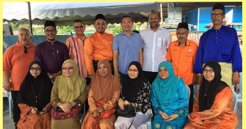
Ahli jawatankuasa AMANAHA Puchong bergambar kenangan bersama Gobind.