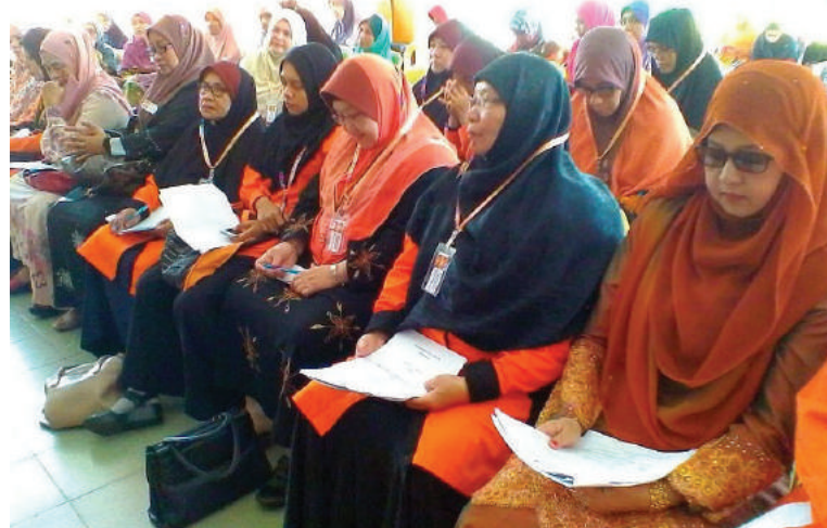
Perwakilan Konvensyen Awan Kelantan tekun mengikuti persidangan.

Hampir 100 pemerhati turut hadir pada konvensyen itu selain perwakilan terdiri jawatankuasa negeri, kawasan Machang dan Tumpat.