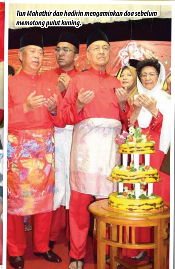
Tun Mahathir dan hadirin mengaminkan doa sebelum memotong pulut kuning.