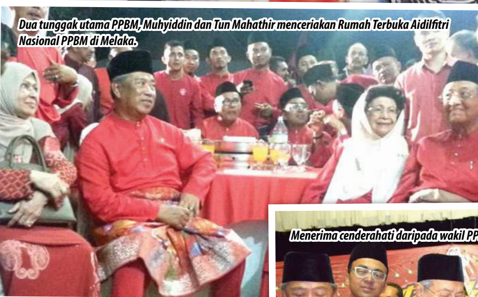
Dua tunggak utama PPBM, Muhyiddin dan Tun Mahathir meneriakkan Rumah Terbuka Aidilfitri Nasional PPBM di Melaka.