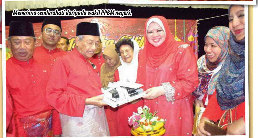
Menerima cenderahati daripada wakil PPBM negeri.