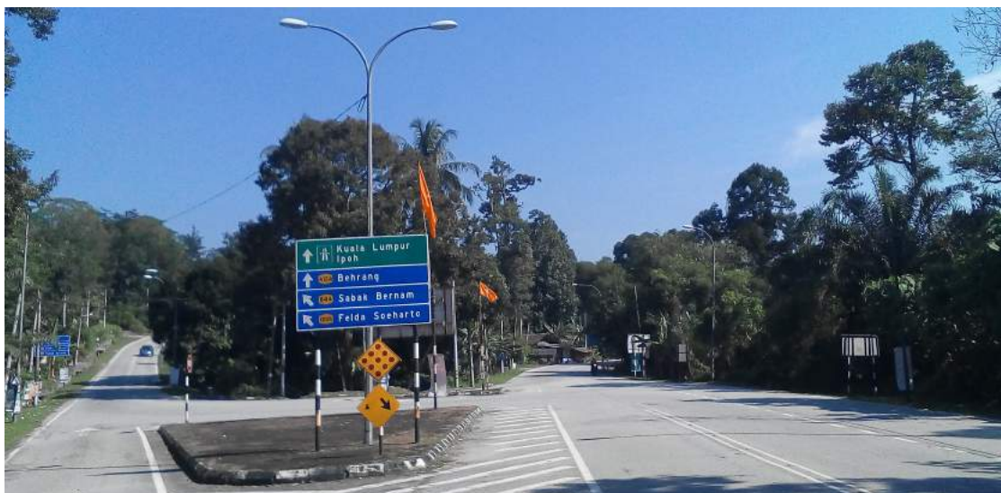
Bendera AMANAH mudah ditemui di jalan-jalan utama sekitar kawasan Felda di Dun Hulu Bernam.

"NGO-NGO yang besar juga wujud dari Gedangsa tetapi di Gedangsa sendiri nasib keluarga peneroka masih banyak belum terbela sebab kebanyakannya lebih kepada kepentingan diri," tambahnya lagi.