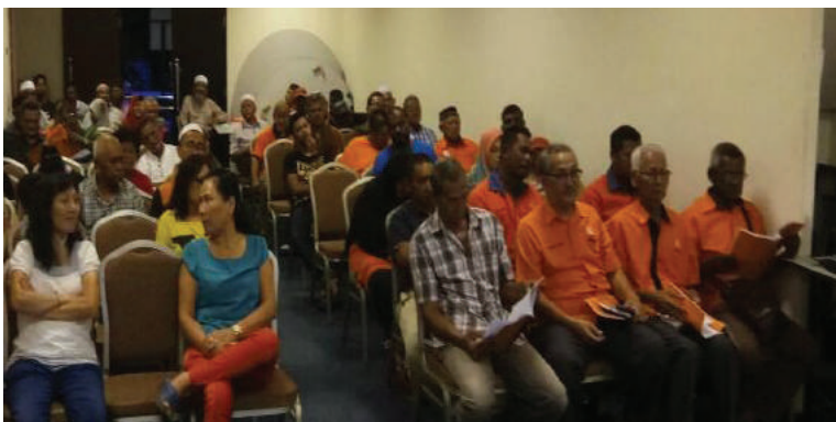
Antara perwakilan dan pemerhati yang hadir pada mesyuarat agung AMANAH Parit Buntar.

"Pengundi Cina dan India kekal memberi sokongan kepada PH, manakala peningkatan sokongan pengundi Melayu kepada PH sangat ketara selepas PPBM menyertai PH," katanya ketika ditemui semasa Mesyuarat Agung AMANAH Parit Buntar kali pertama di Pekan Lama, dekat sini, baru-baru ini.