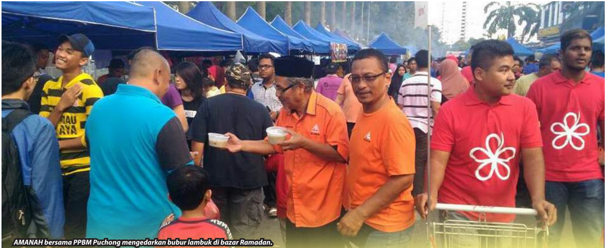
AMANAHA bersama PPBM Puchong mengedarkan bubur lambuk di bazar Ramadan.