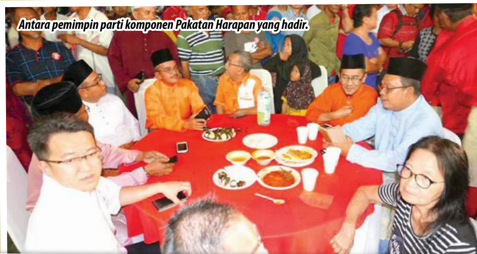
Antara pemimpin parti komponen Pakatan Harapan yang hadir.

Majlis rumah terbuka itu juga dikejutkan dengan sambutan ulang tahun kelahiran Tun