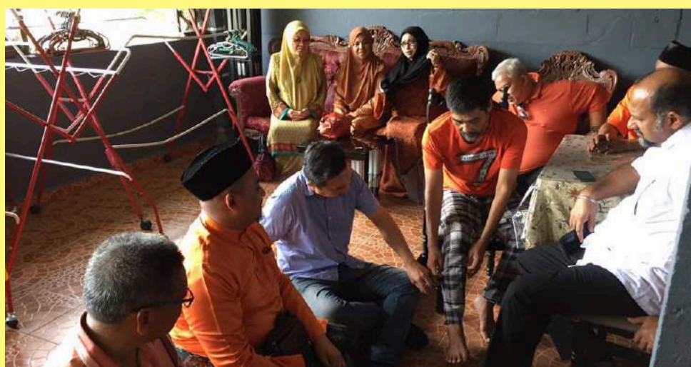
AMANAH Puchong bersama ahli parlimen Puchong Gobind Singh Deo melawat aktivis AMANAH yang terlibat dalam kemalangan.

“... Sekarang ini bukan lagi masa untuk memujuk pihak-pihak yang enggan menentang kepincangan Umno BN sebaliknya Pakatan Harapan perlu mengukuhkan kerjasama keempat-empat parti bagi menghadapi PRU14.