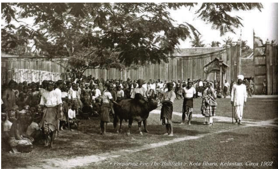
Preparing For The Bullfight - Kota Bharu, Kelantan, Circa 1902